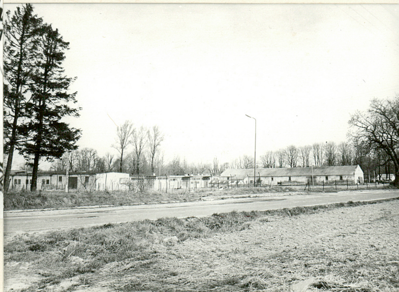
widok ogólny cz. folwarcznej

„Integraf” Lublin, Z-d 1, zam. 614 82 3000