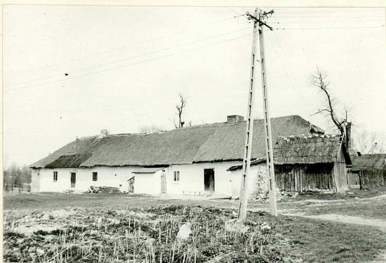
d. czworaki /7/