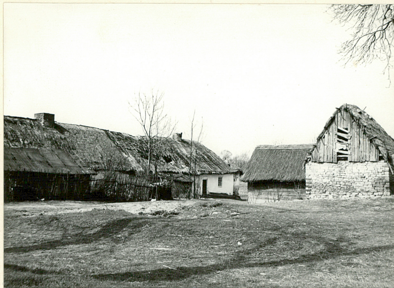
widok ogólny d. gumna