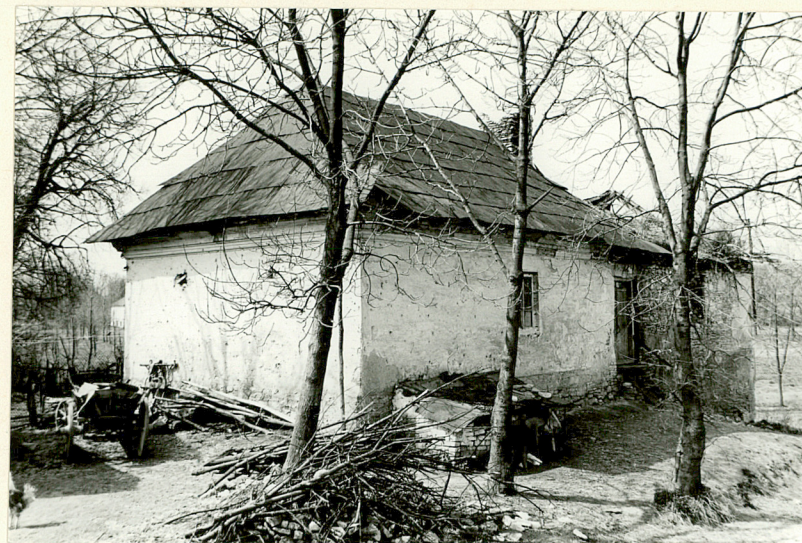
d. kaplica ariańska ? /12/