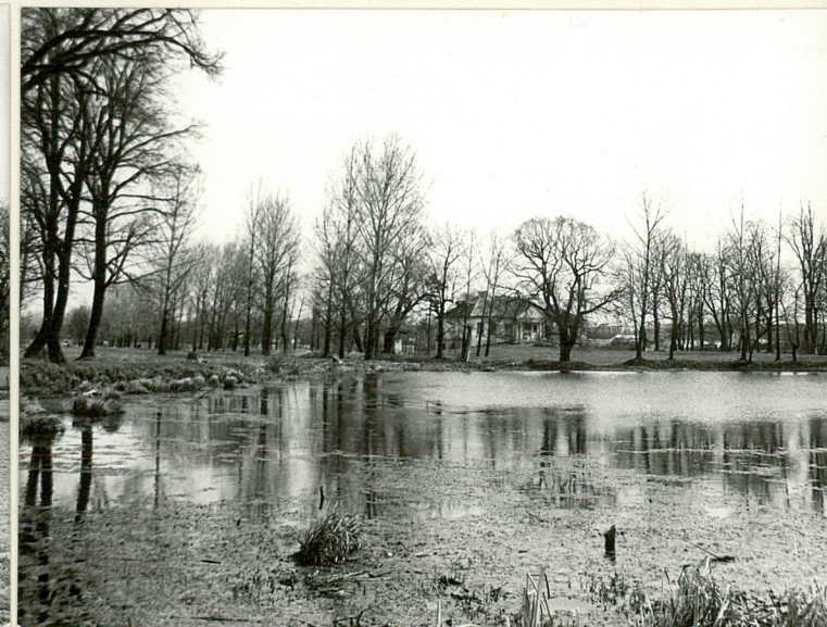
widok ogólny od str. pd.- zach.