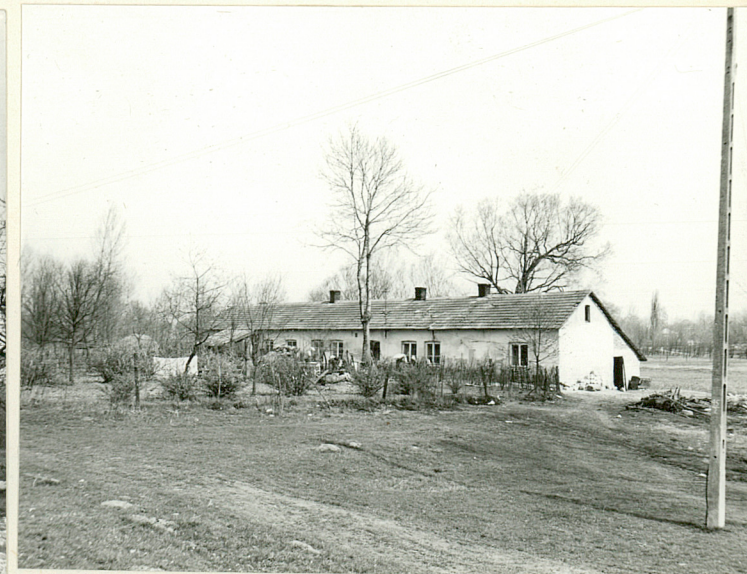
d. kurnik /2/