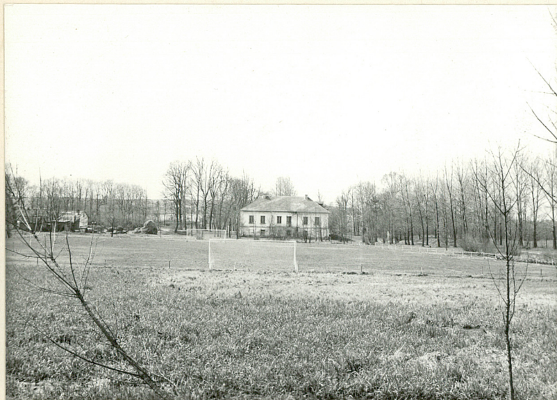
widok ogólny od str. pn.