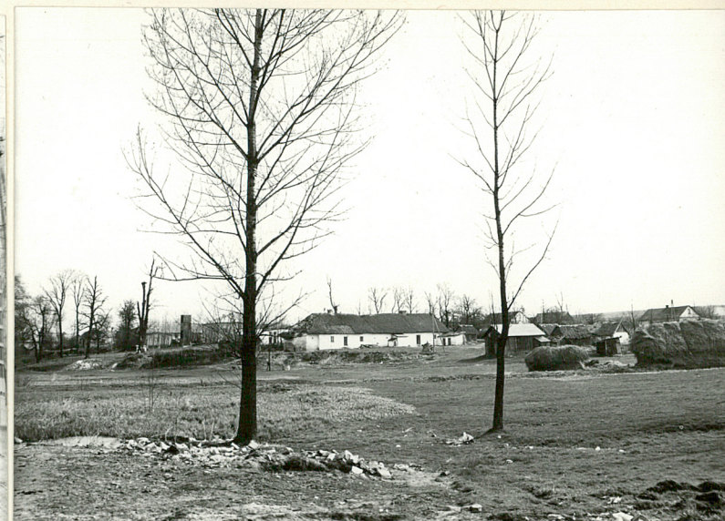
widok ogólny dw. gumna w cz. pn.-wsch.