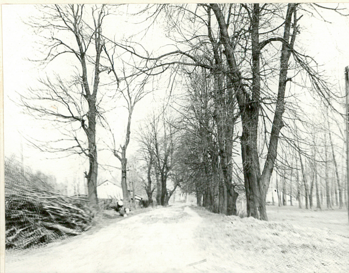
aleja dojazdowa do dworu od str. pd.-wsch.