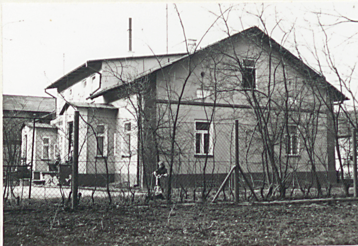
Widok od pd.

Instalacje: Elektryczna, c.o., wod.-kan., telefon.