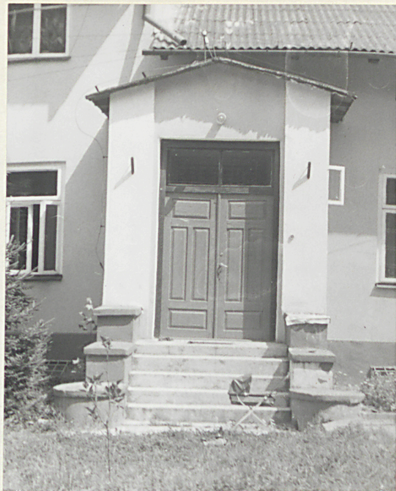
Ganek elewacji tylnej.