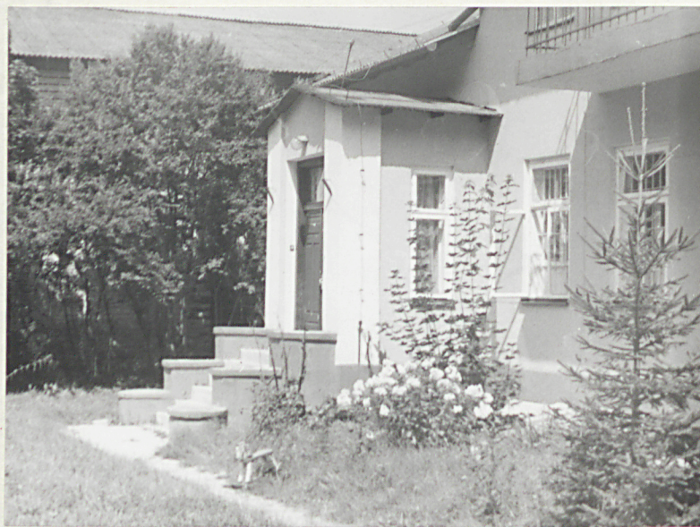
Fragment elewacji tylnej.