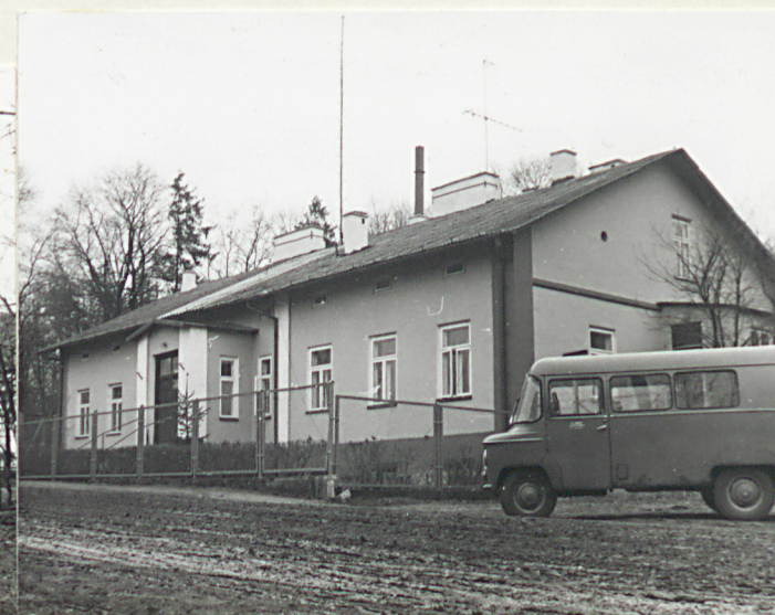
Widok od pn.

Wkładkę założył: Zbigniew Pastuszek, IV 1988r. (imię, nazwisko, data)