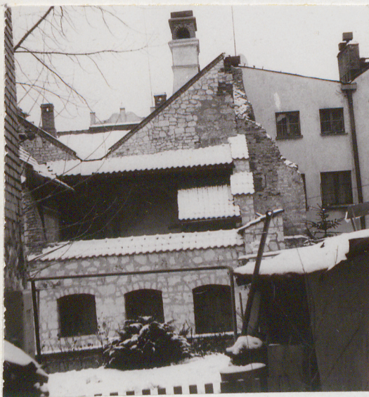
Fot.1. Widok od podwórza.