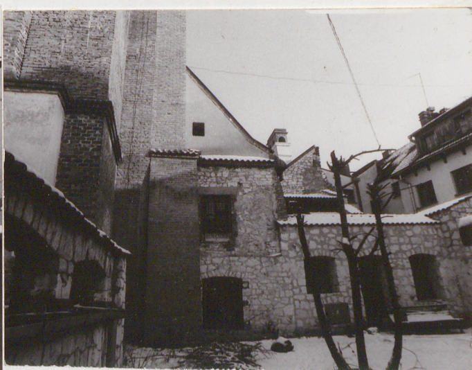
Fot.2. Widok od pd.