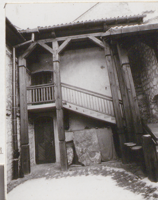
Fot.3. Widok od dziedzińca.