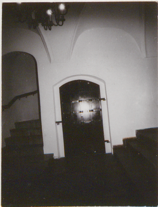
Fot.9.Drzwi do piwnicy.