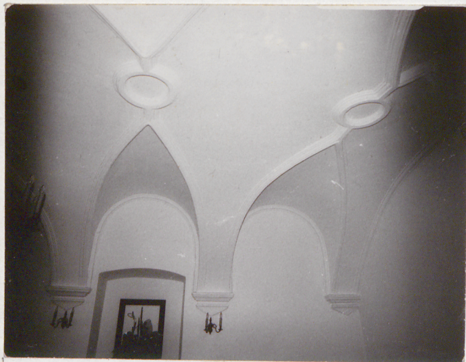
Fot.6.Fragm.sklepienia na piętrze.