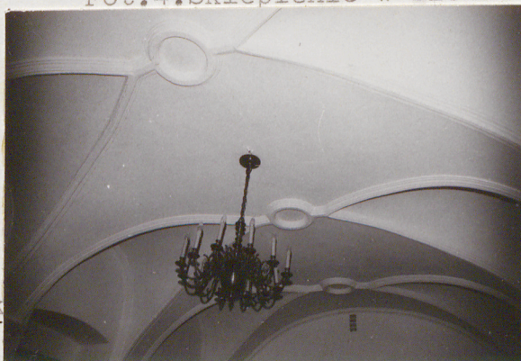
Fot.4. Sklepienie w sieni.