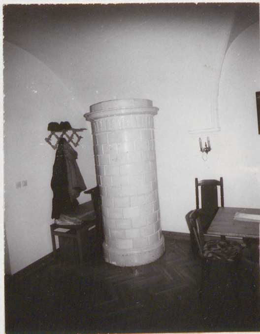
Fot.7.Piec w sali na piętrze.