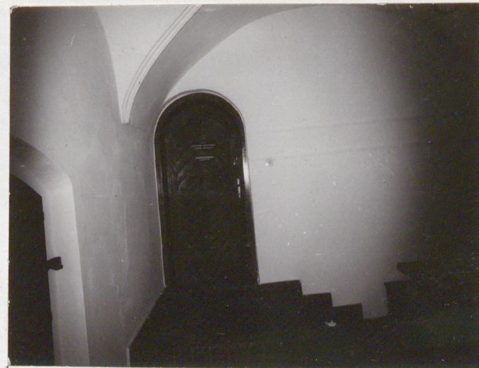
Fot.8.Drzwi do skrzydła tylnego.