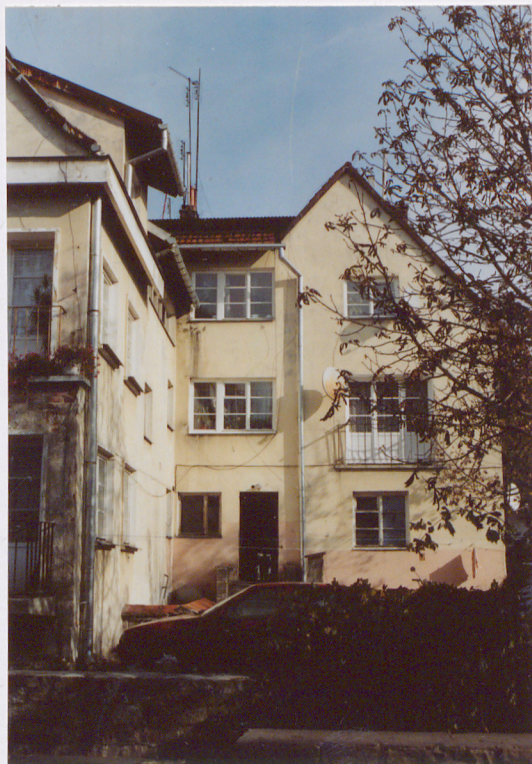
elewacja południowo - zachodnia