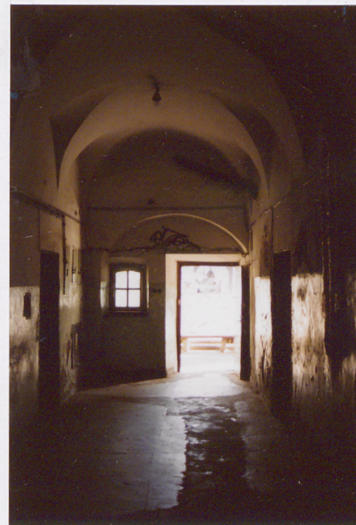
wnętrze, sień przelotowa