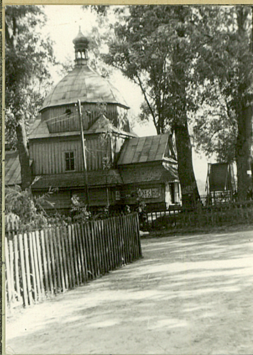
32. Przebieg prac konserwacyjnych

Dzwonnica - drewniana, konstrukcji słup- owej, oszalowana deskami. Kwadratowa, osza- lana pionowymi, dachu kondygnacja. Wyższa kondygnacja 8-boczną z wieżą z wieżą dolną zadaszeniem, nakryta dachem kopułastym, osmiopolewym.