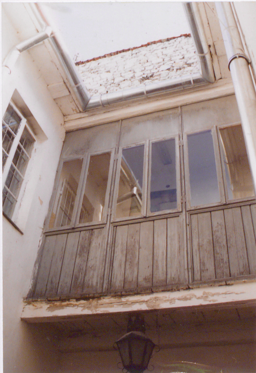
aleria na I piętrze