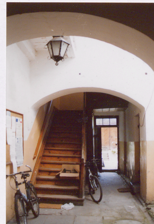
schody w oficynie