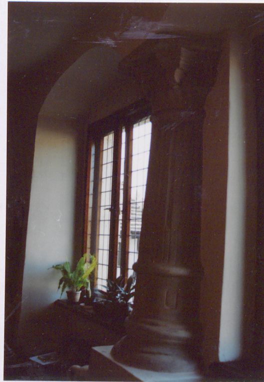
wnętrze, kolumna międzyokienna