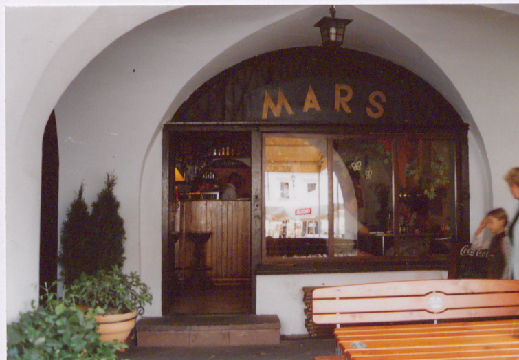
podcień, wejście do baru