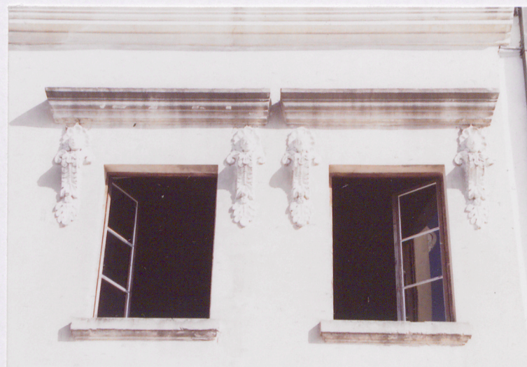
elewacja frontowa, okna