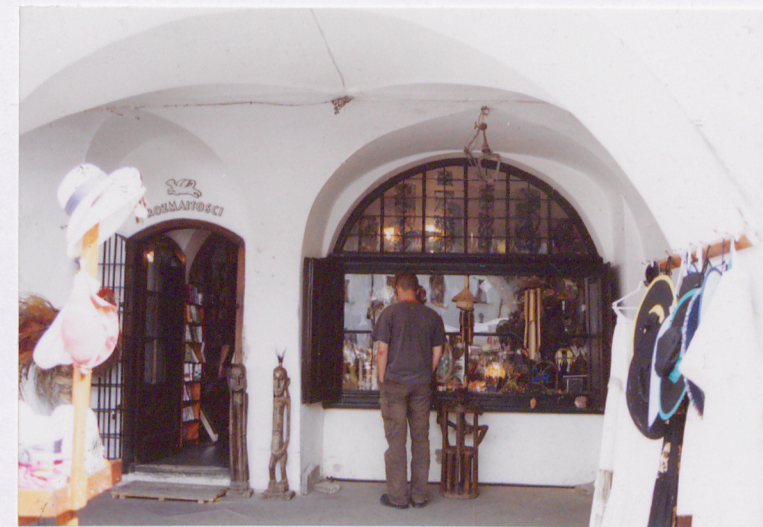
podcień, wejście do galerii