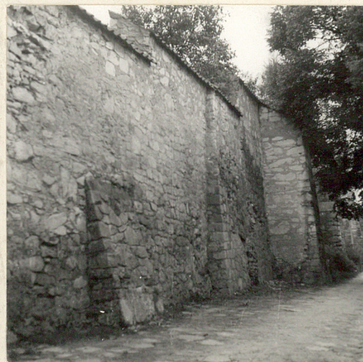
data wykonania 1977 miejsce przechowywania negatywów