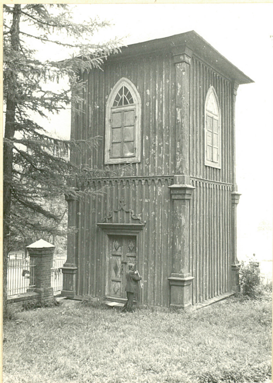
Widok od strony kościoła.

Dzwonnica typu "brogowego", z bogatym zdobnictwem architektonicznym.