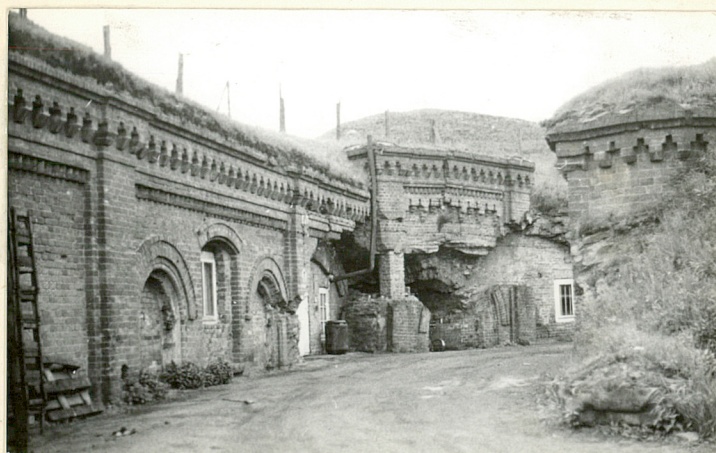
WIDOK KAZAMAT OD DZIEDZIŃCA