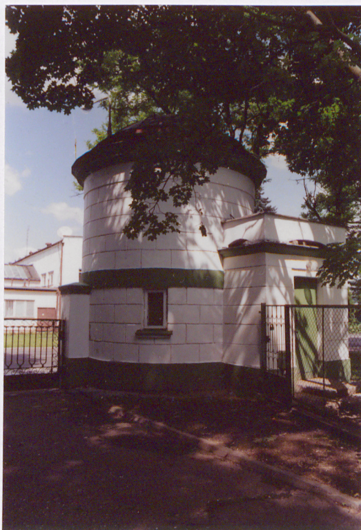
Widok od strony południowo-zachodniej