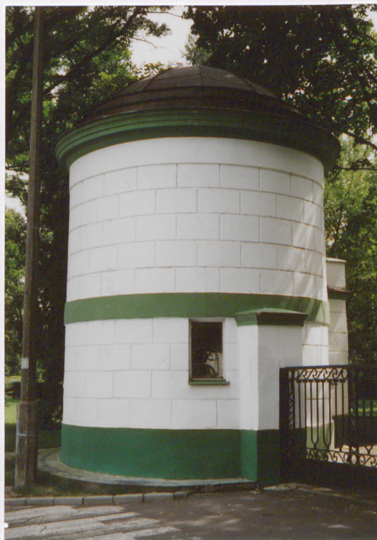
Widok od strony północno-wschodniej