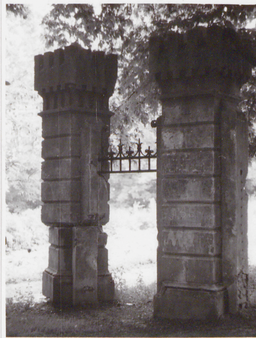
Fot. 2 Furtka - widok od pn.-wsch.