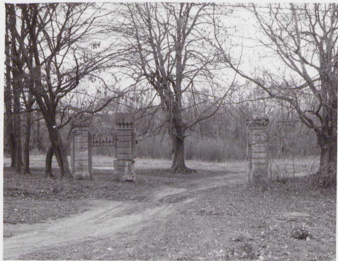
Fot. 1 Widok na bramę od strony pałacu