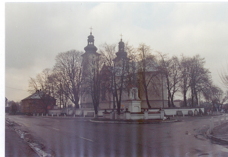
Widok zespołu kościelnego od pd.-wschodu z kapliczką na pierwszym planie.