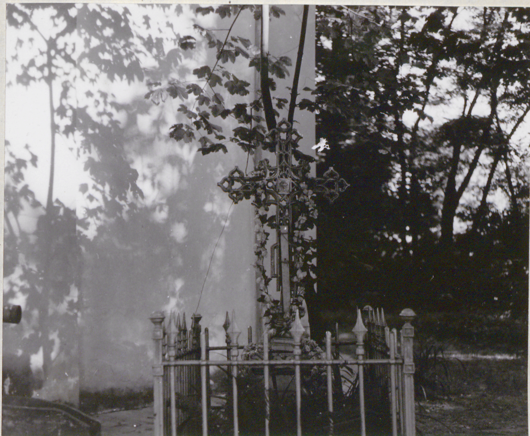
Fot. 2 Grób Konstancji Niewiadomskiej (P.Paschalis - czerwiec 1977)