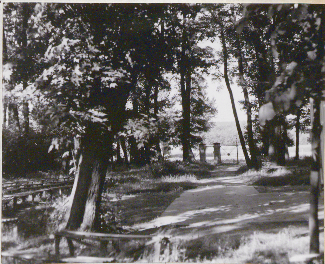
Fot. 3 Alejka prowadząca do kaplicy (P.Paschalis - czerwiec 1977)