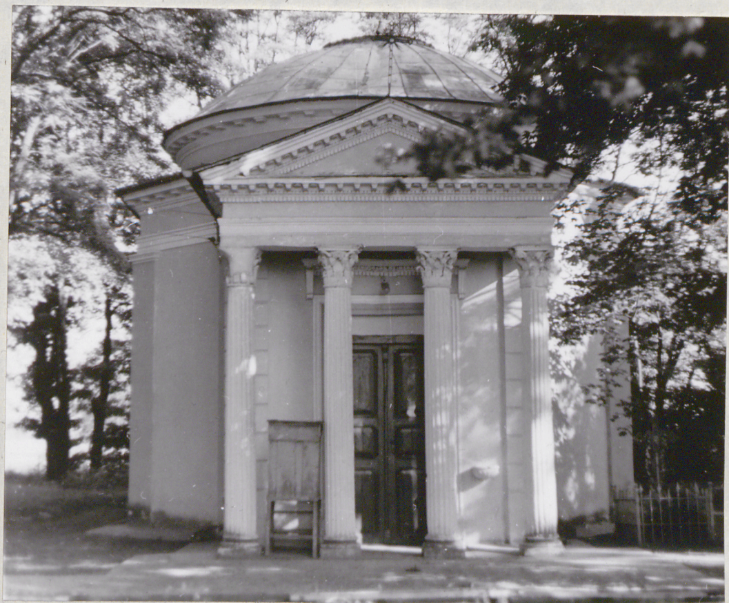
Fot. 1 Elewacja frontowa kaplicy (P.Paschalis - czerwiec 1977)