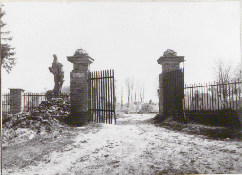
Widok od zach.

Wkładkę założył: mgr Zbigniew Wichrowski IV 1987 r. (imię, nazwisko, data)