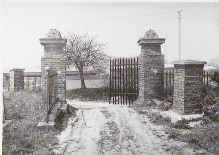
Widok od wsch.