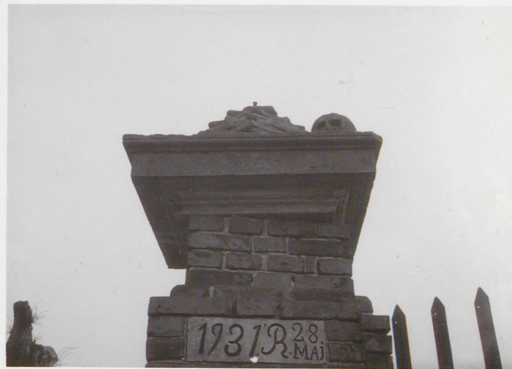
Górna część filara