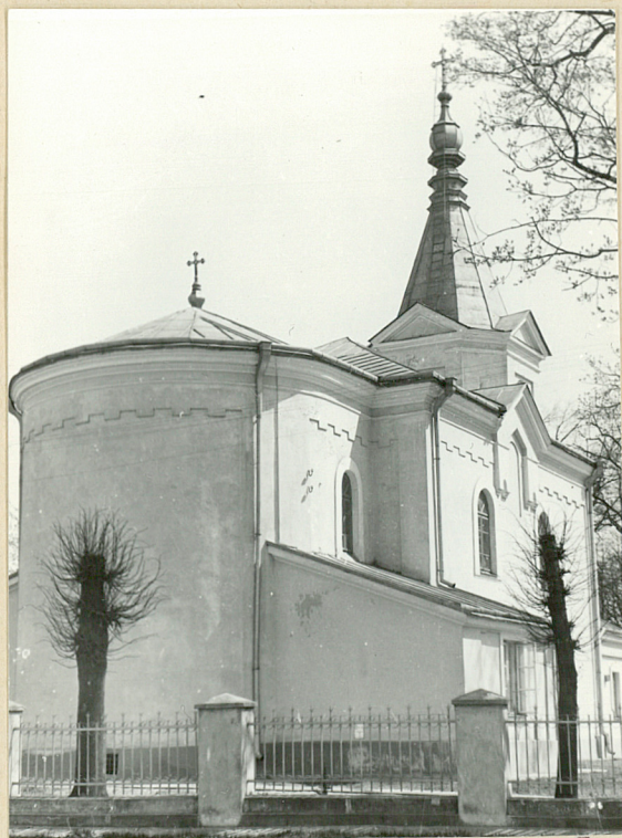
NEG. 12 05