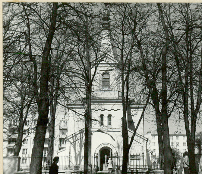
NEG. 12 04