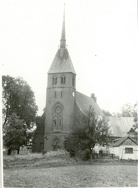
1. Kościół - budowany 1886-1888