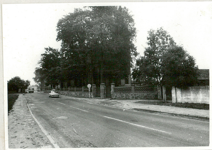
3. Druga brama