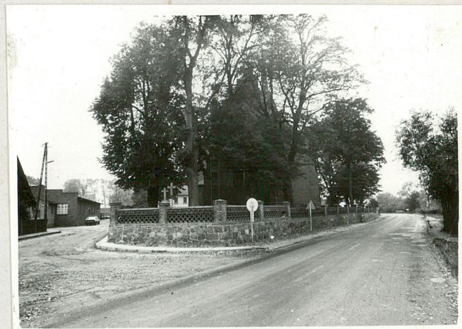
4. Cmentarz przykościelny