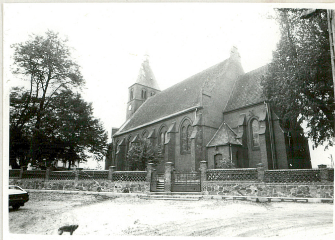
2. Widok od str. szosy