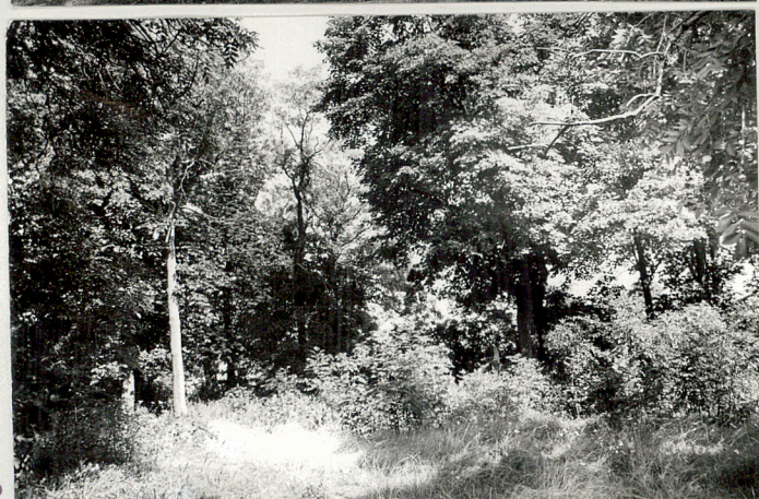
Lubiec Dolny, cm. przykościelny mieczynny 1-2. Widok ogólny 3. Zadrzewienie cmentarza 4. Jesion zwisający 5. Wnętrze cmentarza