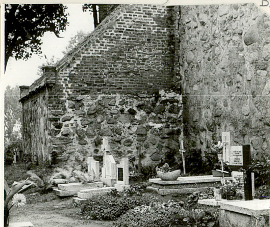
Kwatery przy kościele