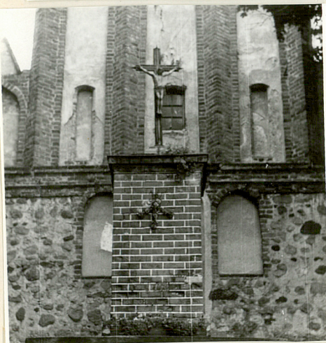
Fragment murów kościelnych