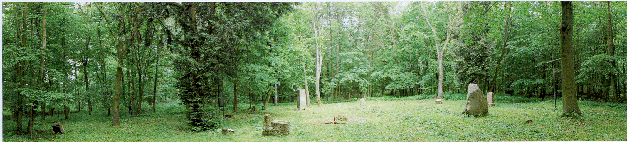
Panorama cmentarza rodowego rodziny Wilamowitz – Moellendorff w Wymysłowicach – czerwiec 2017.