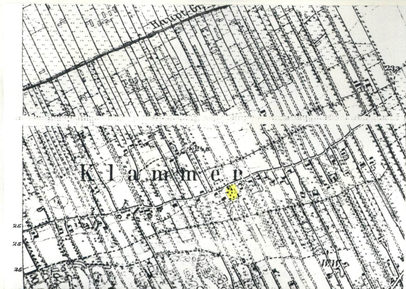
Klamry, cm. nieczynny 1. Widok ogólny