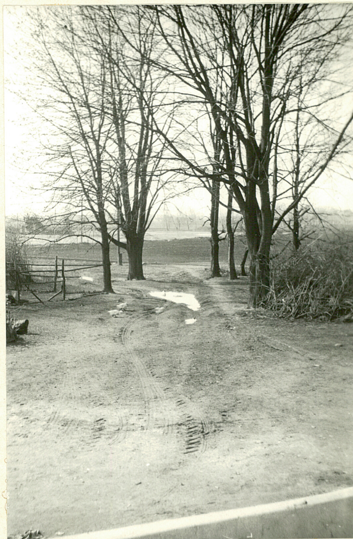
2. Wideo od strony dwerku na wjazd. fot. G.Oleksiejuk - marzec 1983 r.