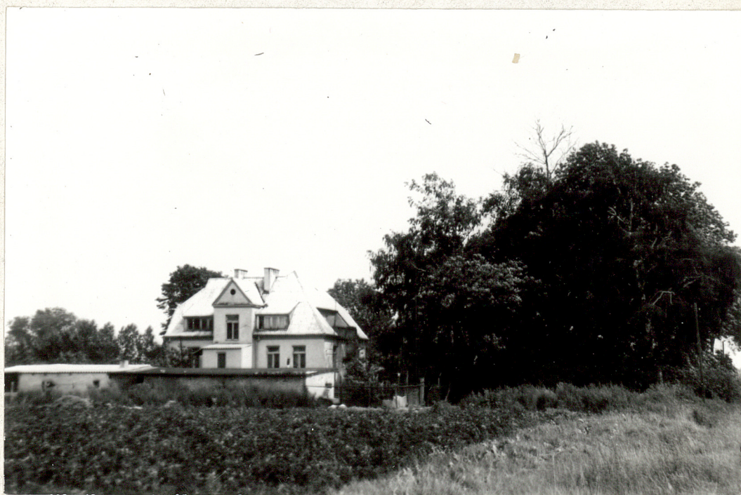
5. Widok dwierku od strony północno- zachodniej. fot.G.Oleksiejuk - lipiec 1983 r.