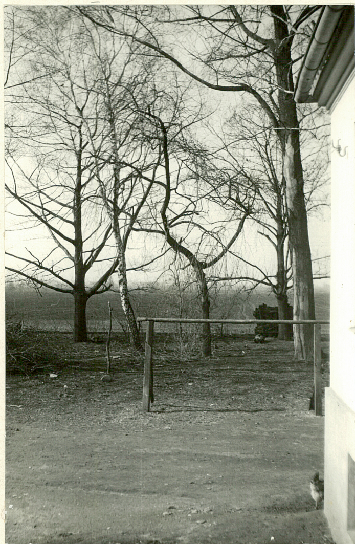
3. Fragment części ozdobnej założenia - widok od strony dworku w kierunku zachodnim. fot. G.Oleksiejuk - marzec 1983 r.