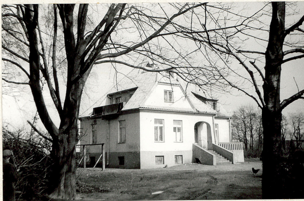
1. Dworek - widek od strony podjazdu - marzec 1983 r.