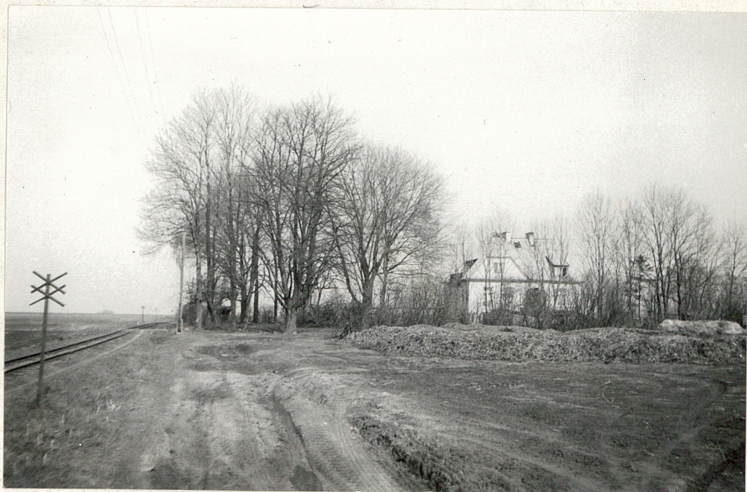
4. Widok ogólny na park od strony obecnej drogi dojazdowej. marzec 1983 r.