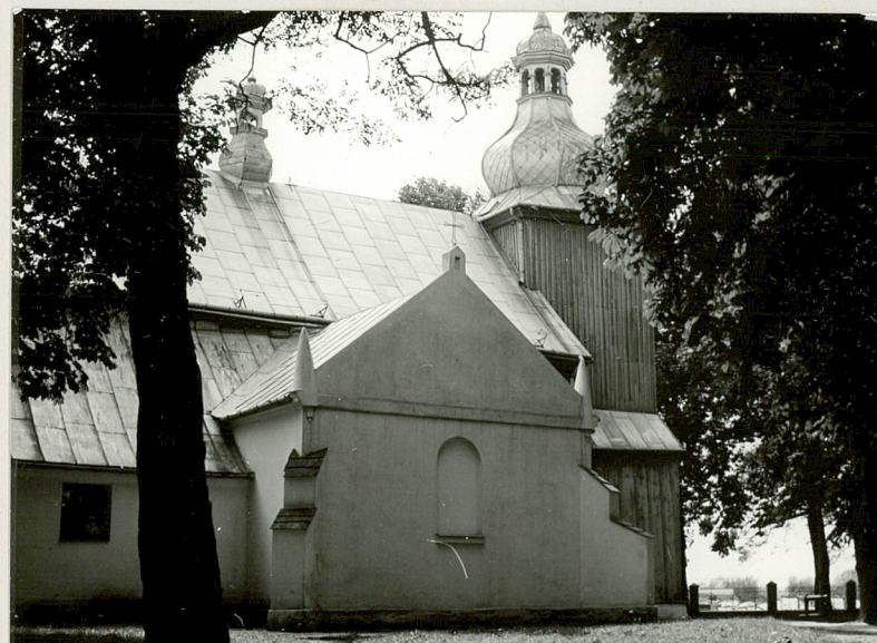
Widok kościoła od str. północnej