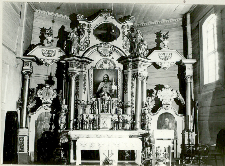
Wnętrze - widok na ołtarz gł.