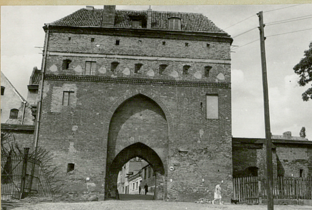
Widok od strony Wisły

Obiekt typu prostokątnego z przejazdem bramnym w podbudzie. Widok z ul. Bankowej. Słabo widoczny ostrołupiany przejazd bramny od strony zewnętrznej otoczony ostrołupianą murką, której wągaty przystosowane do podnoszenia chroniącej bramy brzozy. Powyżej rebrnego furtu kondygnacja pochodząca z pierwszej połowy XVIII, przekształcona w XIX.