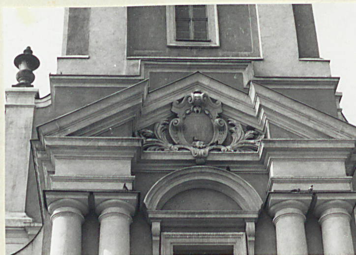
elewacja wsch. - detal