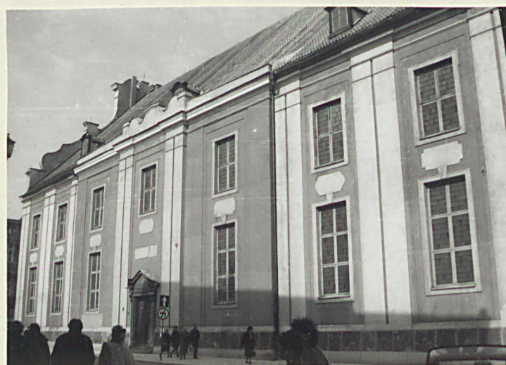
widok od strony poł.