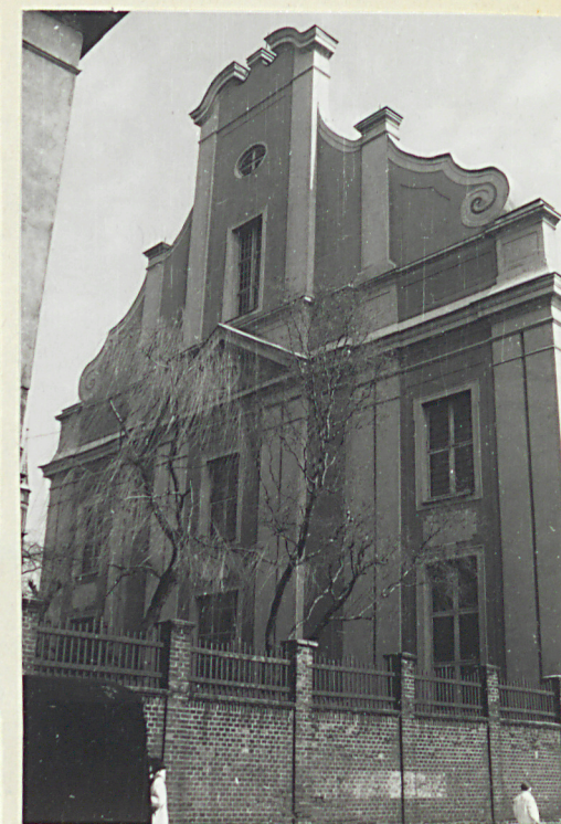
widok od strony zach.