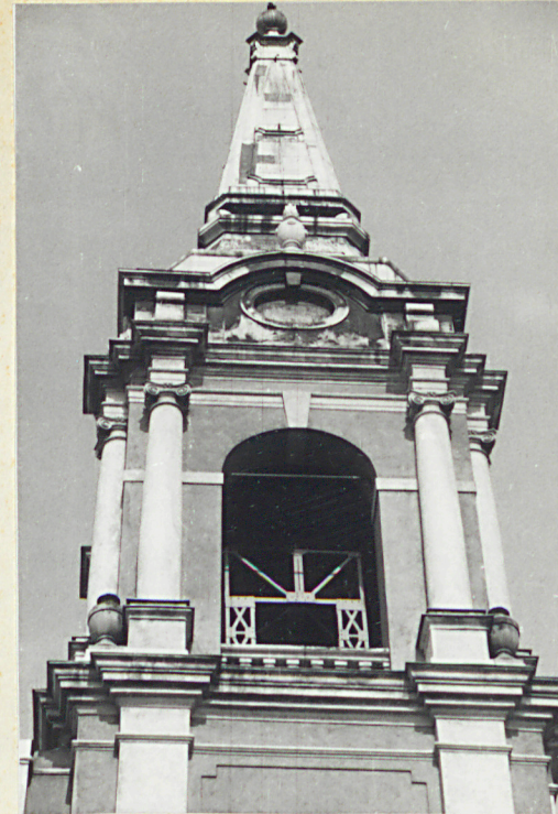
elewacja wsch. - hełm wieży