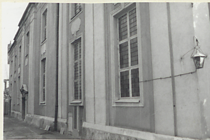
widok od strony półn.