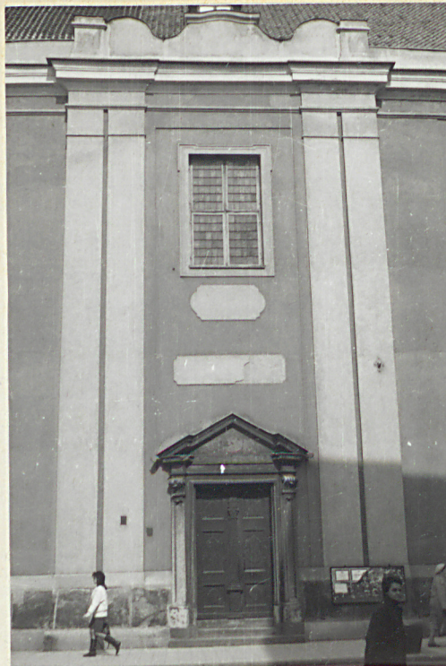
elewacja pd. - fragment