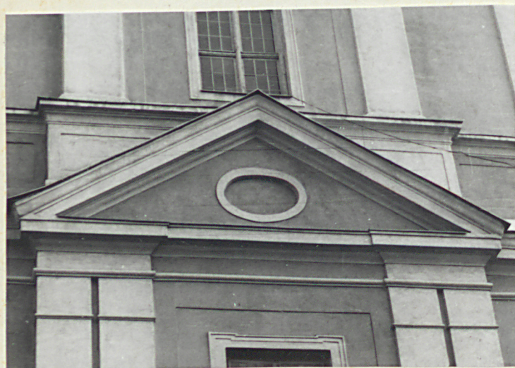
elewacja zach. - detal