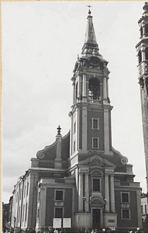
widok od strony zach.