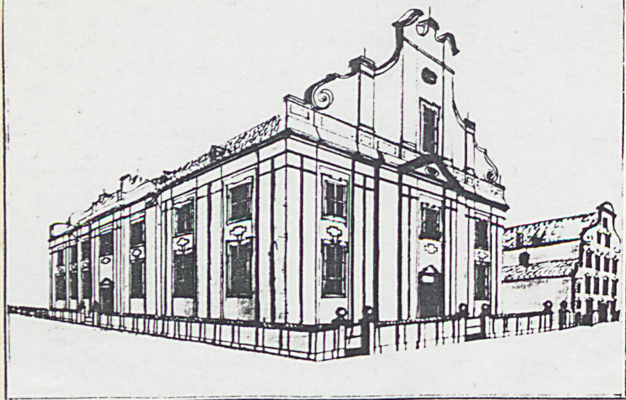
reprodukcja rys. archiwalnego Steinera z XVII w.

Nach einander Perfect. Aufsicht desselbigen. Bethhauses.