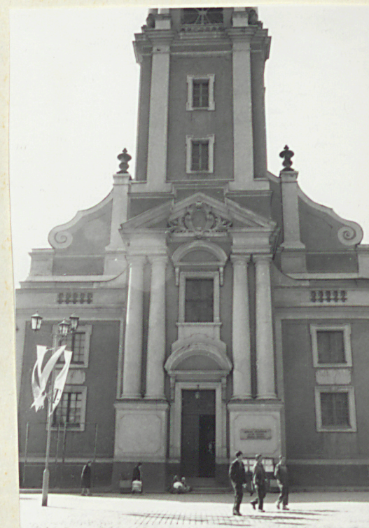
elewacja wsch. - tizon wieży