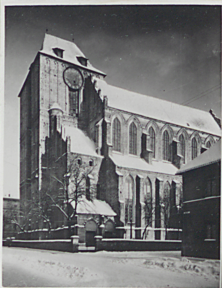
widok od ul. Żeglarskiej / pld.-zach.