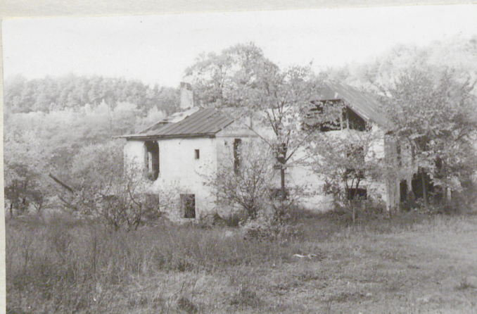
5. Elewacja boczna z przybudówką