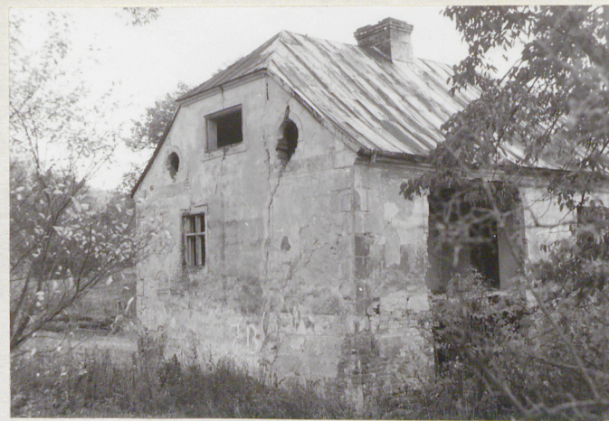
3. Elewacja boczna