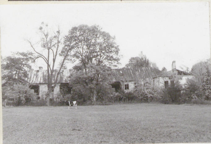
2. Elewacja tylna