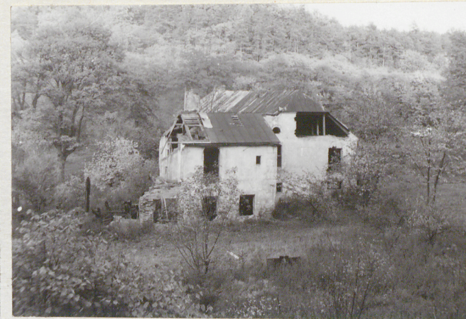
4. Elewacja boczna z przybudówką