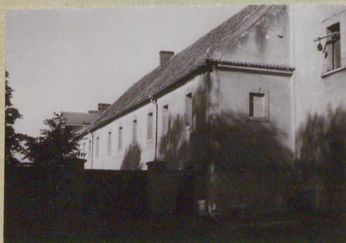
Widok od płd.-zach.

Budowla tworzy z kościołem, do którego przylega dwoma skrajkami - czworobok.