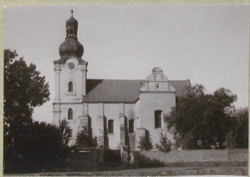
Elewacja poł. 1959r. ↗

31. Szkic sytuacyjny, plan schematyczny, uwagi opisowe, fotografia Zakończony na planie krzyża łacińskiego, którego ramiona tworzy transept. Od zach. za ołtarzem głównym usytuowana kwadratowa wieża zwieńczona barokowym hełmem. Na zewnątrz oszkarpane. Od półn. przylega dwoma skrzydłami klasztor oo. Oblatów.