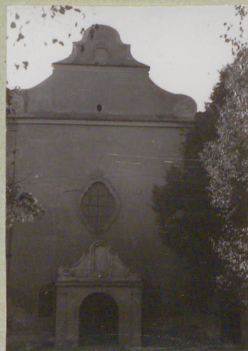
Elew. frontowa - wsch.