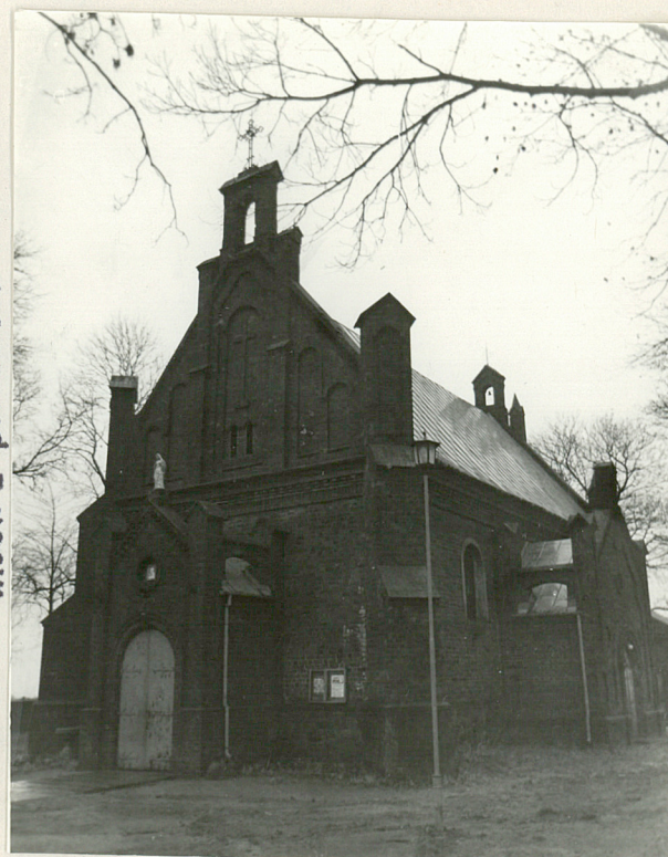
widok z pd-zach.