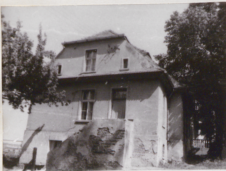
1. Elewacja południowa

3. Zawartość wkładki (nazwa obiektu lub materiału uzupełniającego) zdjęcia