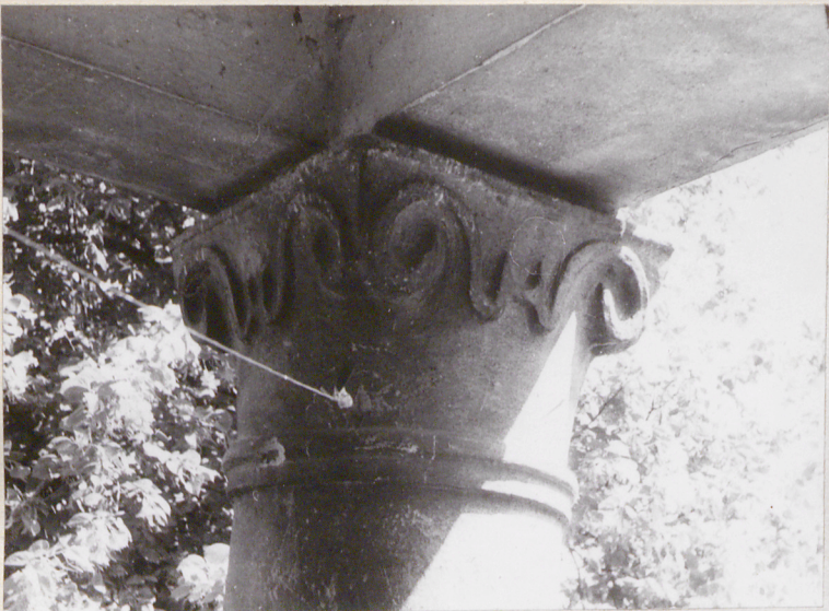
1. Elewacja frontowa, ganek głowica kolumny