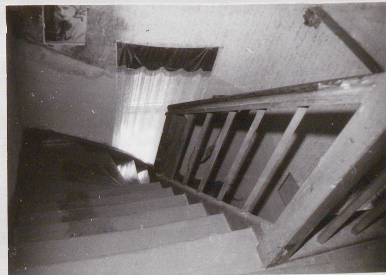
4. Klatka schodowa w narożu południowym