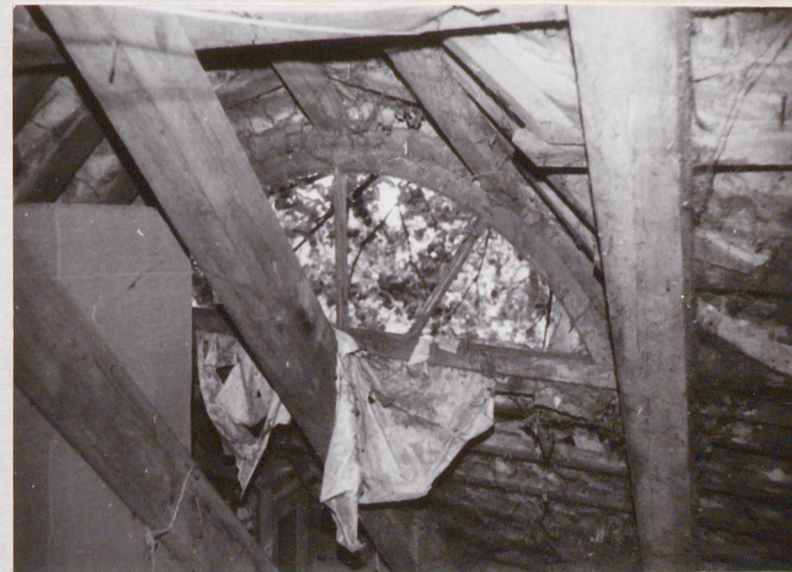
4. Elewacja frontowa-wschodnia okno poddasza, widok od strychu