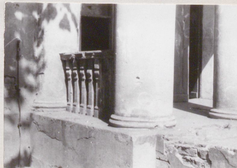
4. Elewacja frontowa ganek, tralki i bazy kolumn

mgr inż.arch. Z.Wernerowska mgr inż.arch. M.Grzybowska