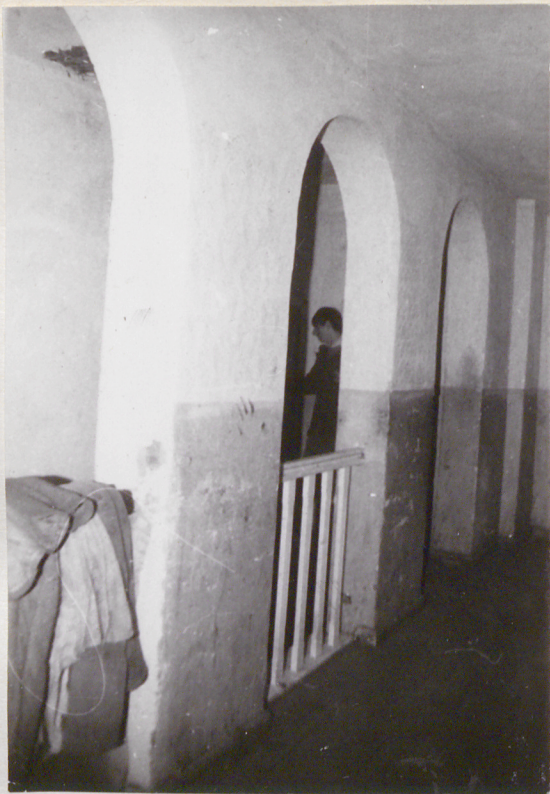
1. Piętro, klatka schodowa