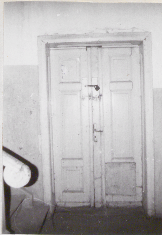
2. Parter, drzwi wewnętrzne