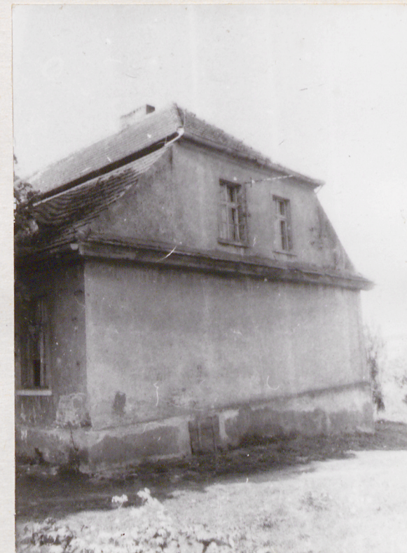
3. Elewacja północna