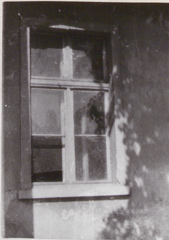
2. Elewacja frontowa-wschodnia parter, okno