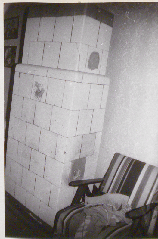
3. Parter, piec