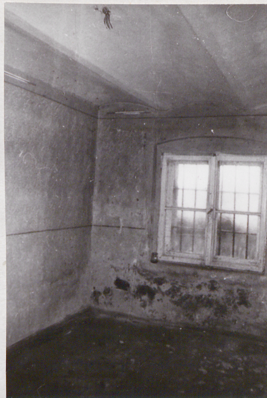
2. Narożnik południowo- zachodni, piwnica pomieszczenia b.kuchni