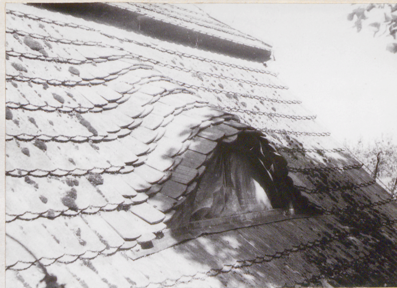
3. Elewacja frontowa-wschodnia okno poddasza