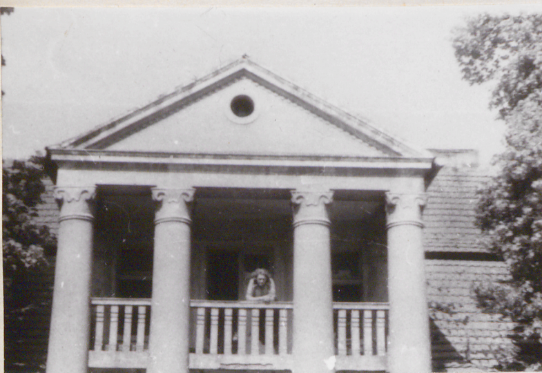
1. Elewacja wschodnia-frontowa ganek, piętro

3. Zawartość wkładki (nazwa obiektu lub materiału uzupełniającego) zdjęcia