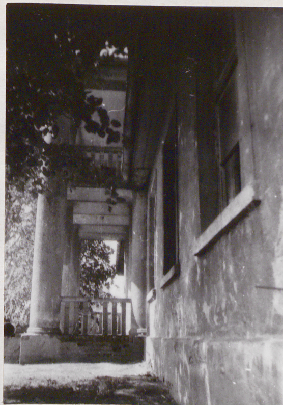
2. Elewacja frontowa, ganek, widok z boku