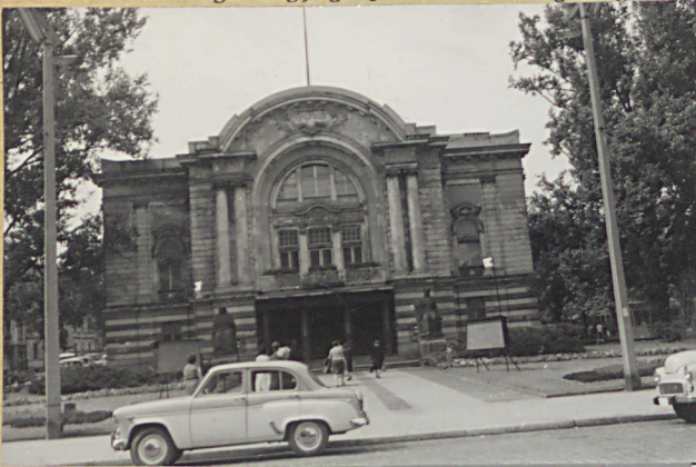
31. Szkic sytuacyjny, plan schematyczny, uwagi opisowe, fotografia