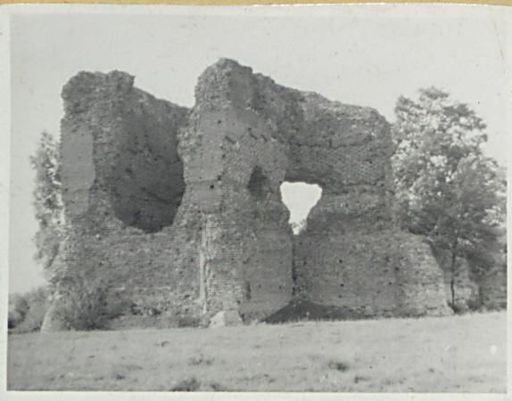
Ruina zamku od str. pld-wsch.