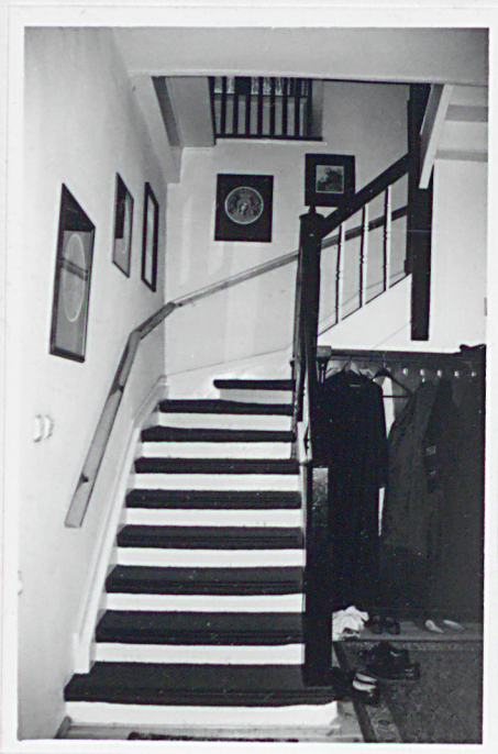
Śień. Widok na schody.