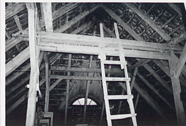
Wizba dachowa budynku głównego.