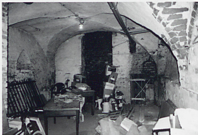
Budynek główny. Piwnica w części pd. Widok od strony wsch.