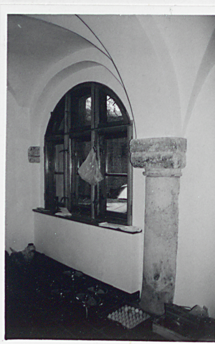
Fragment parteru oficyny z kamienną kolumną w ścianie pn.