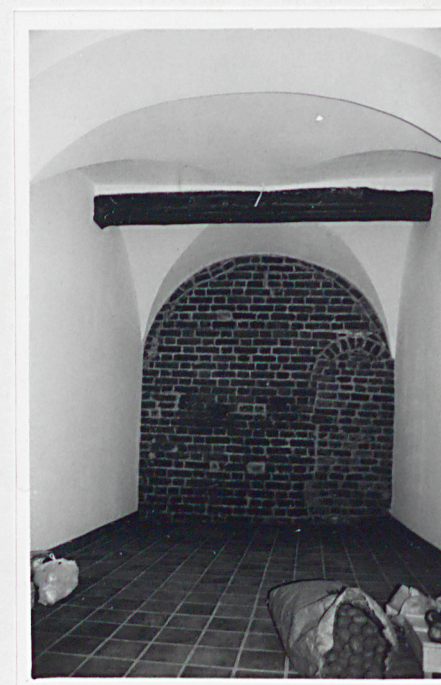
Parter oficyny. Widok na ścianę wsch..