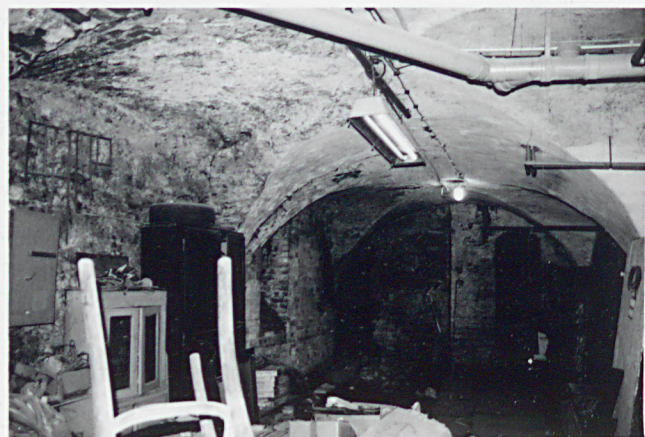
Budynek główny. Piwnica w części pn. Widok od strony zach.