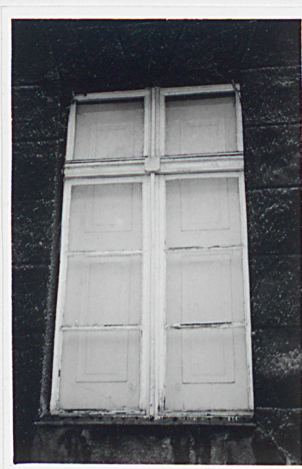
Elewcja frontowa. Okno klasycystyczne z wewnętrznymi okiennicami.