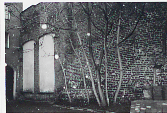
Mur pd, widoczny od strony pd. - wsch..