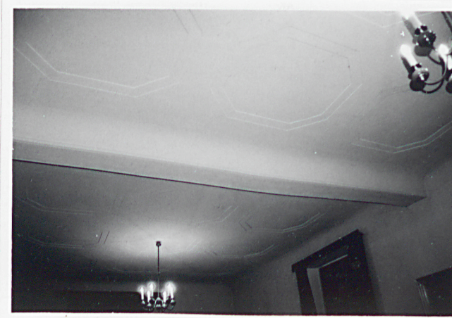
Budynek główny. Strop na 1. piętrze w tylnym trakcie.