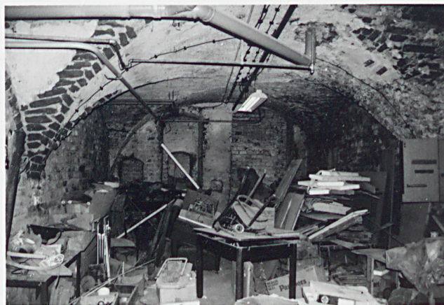
Budynek główny. Piwnica w części pn. Widok od strony wsch.