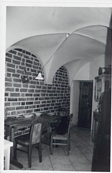
Parter oficyny ze sklepieniem krzyżowym.