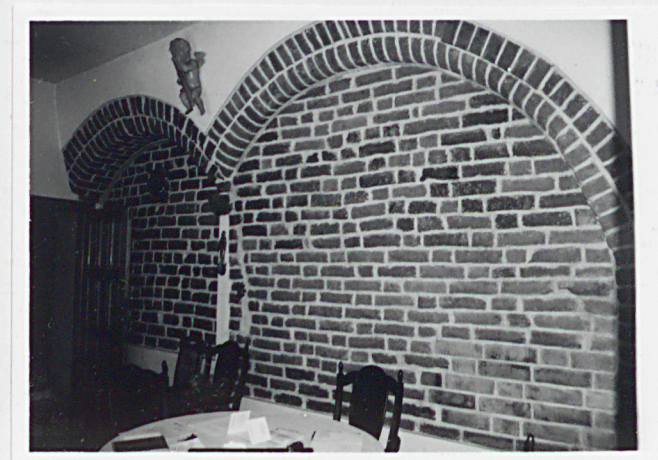
Parter. Budynek główny, wnęki na ścianie pd.