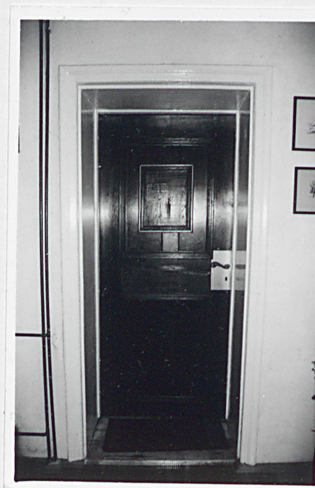
Drzwi na parterze