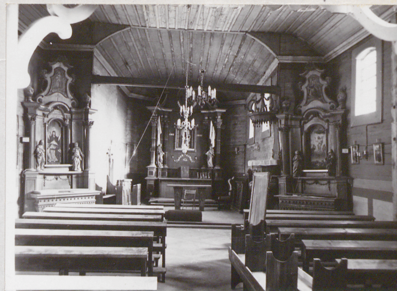
Wnętrze - widok na str.wsch.