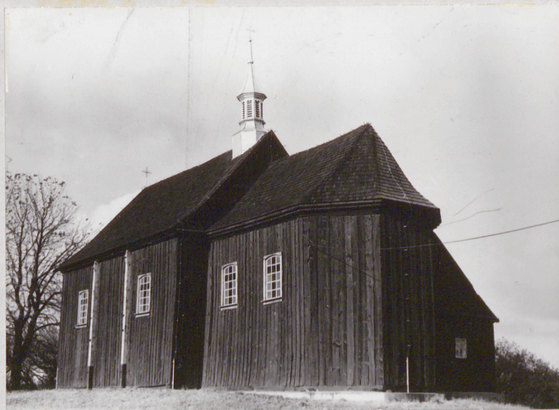
Widok kościoła od str.płd.-zach.