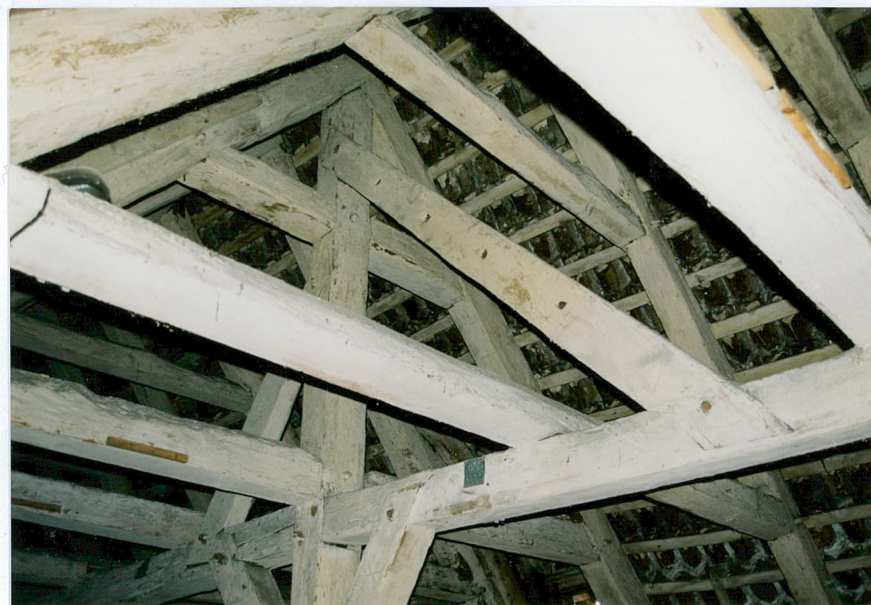
22. Dolny fragment konstrukcji drewnianej szczytu pd.