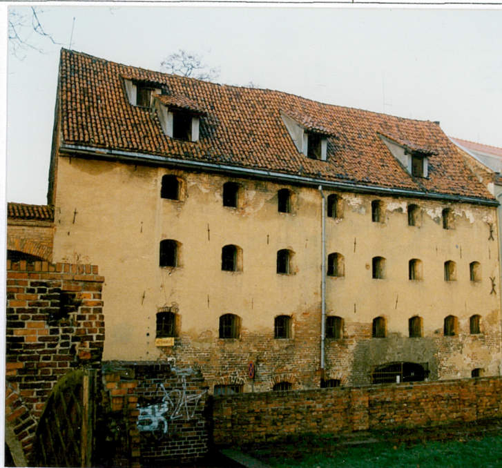
1. Widok ogólny na spichrz od wsch.