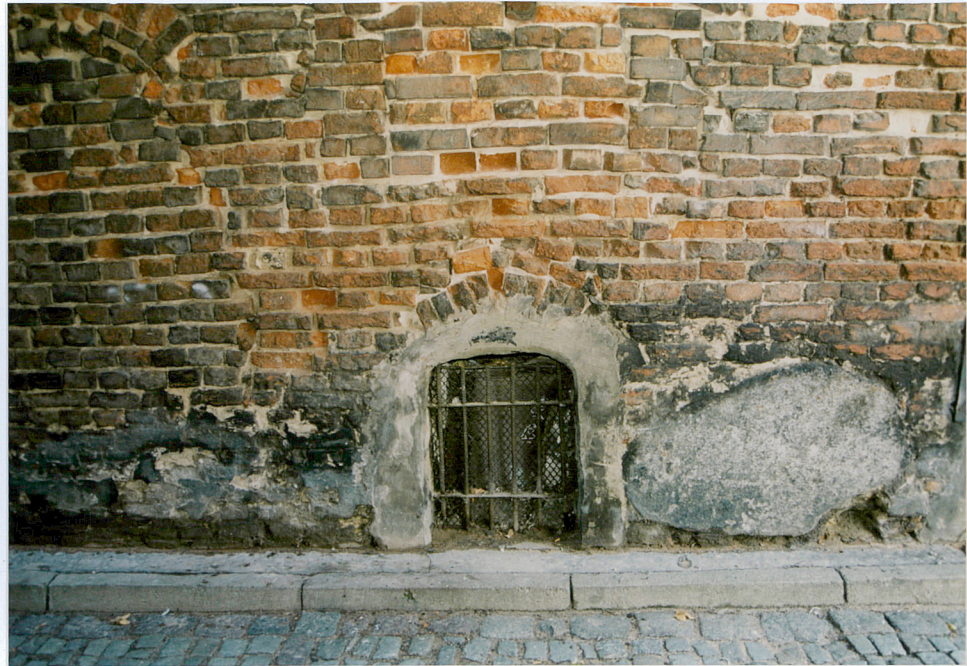
13. Otwór okna piwnicznego w elewacji pd.