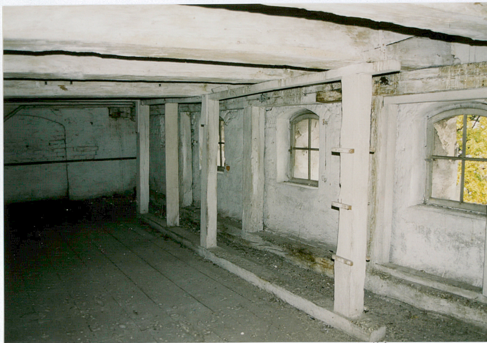
18. Widok fragmentu konstrukcji usztywniającej belki stropowe na drugim piętrze spichrza. Widok narożnika pn. – wsch.