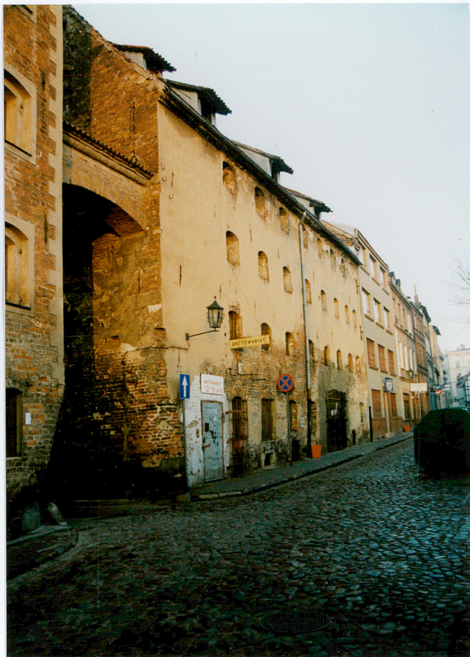
2. Widok ogólny spichrza od strony ul. Podmurnej.