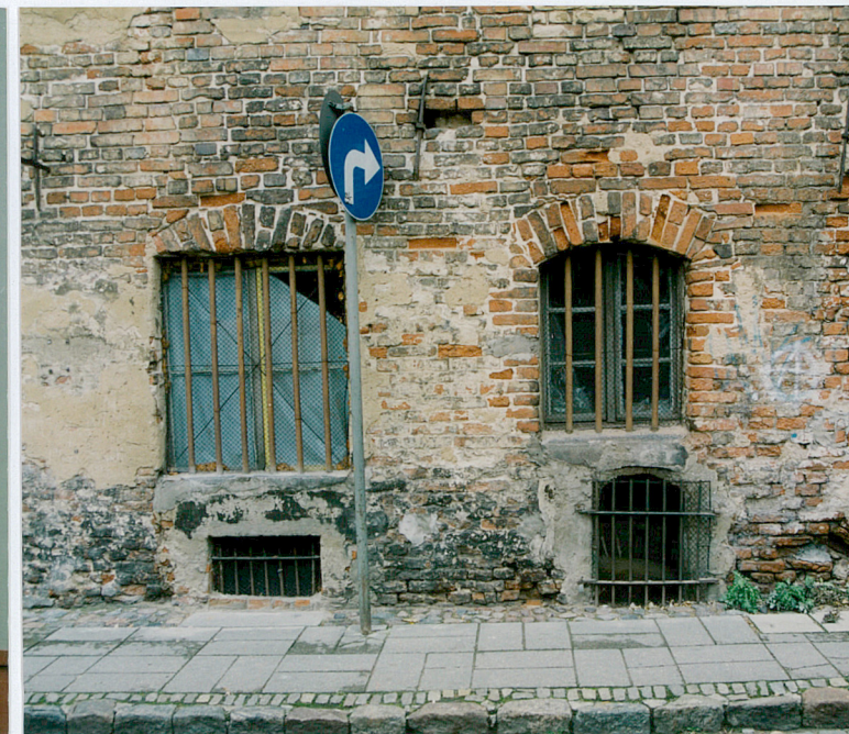
7. Otwory okienne na parterze elewacji frontowej.

Wkładkę złożył: mgr Piotr Tuliszewski 16.11. 2002 r.