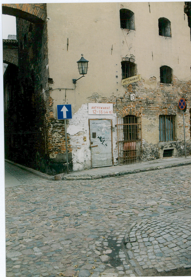
3. Otwór wejściowy do spichrza.