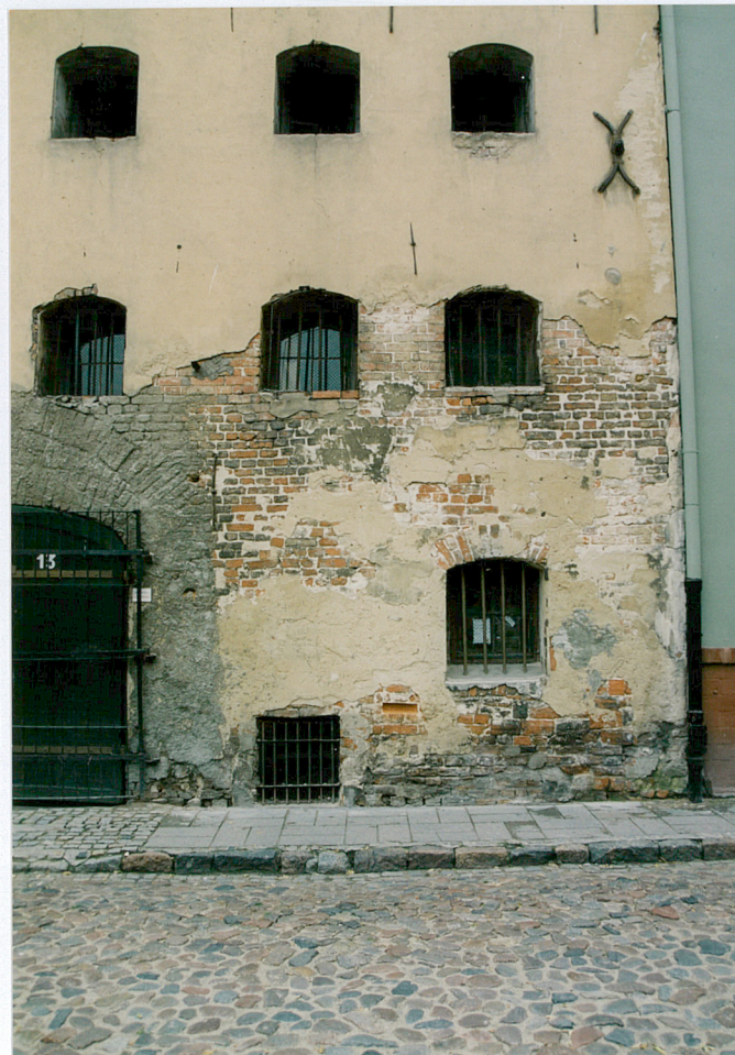
6. Dolny północny fragment elewacji frontowej.