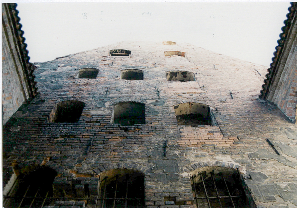
10. Widok ogólny na górne partie elewacji południowej.

30. Zawartość wkładki (nazwa obiektu lub materiału uzupełniającego) fotografie