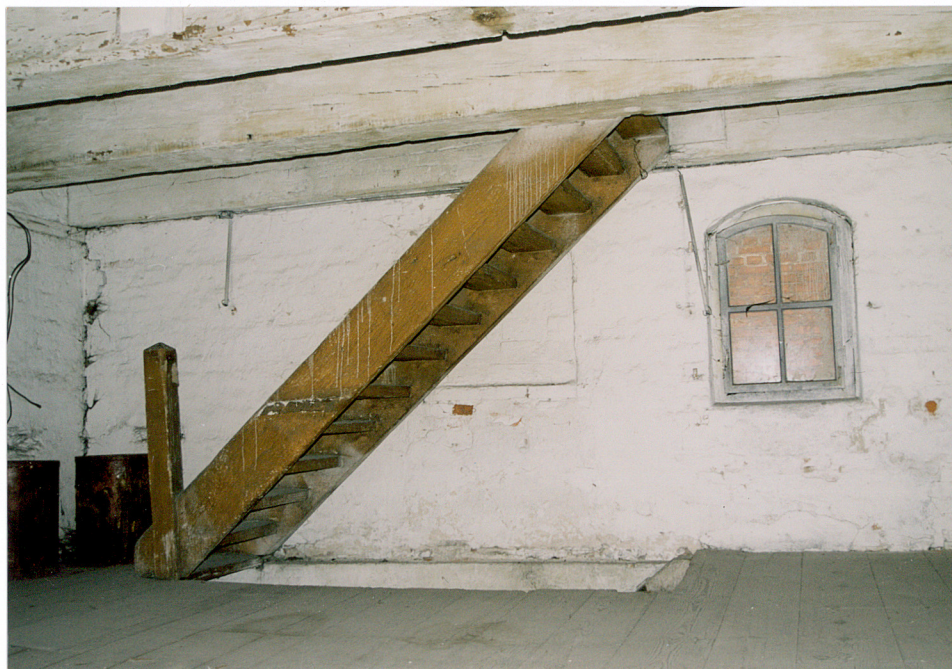
27. Schody drabiniaste na drugim piętrze spichrza.