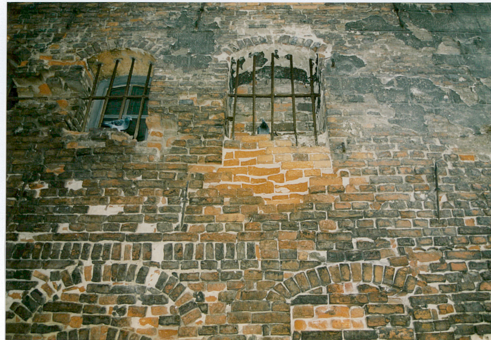
14. Zamurowane otwory okienne na parterze elewacji pd.

Wkładkę założył: mgr Piotr Tuliszewski 16.11. 2002 r.