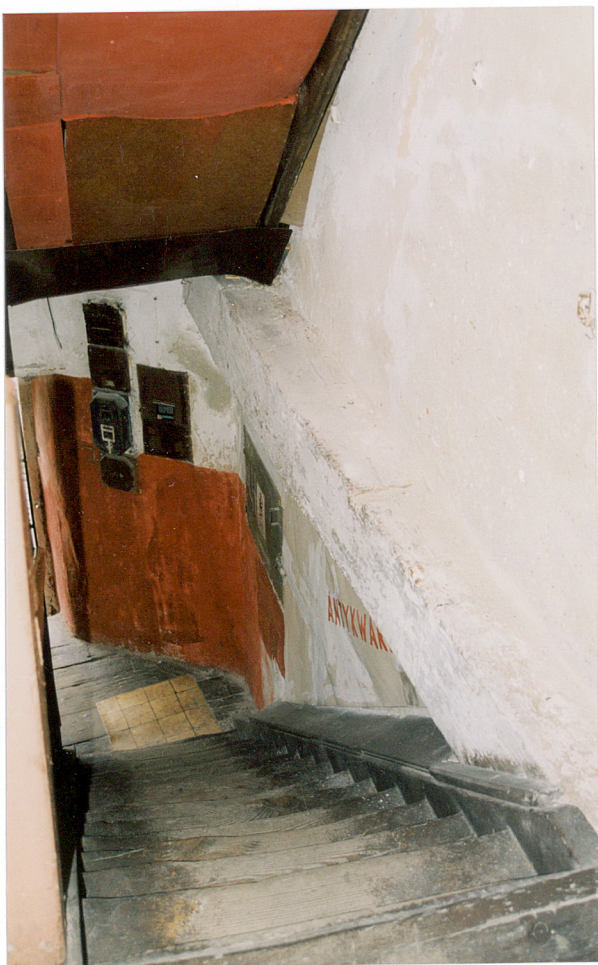
26. Bieg schodów na pierwsze piętro spichrza.