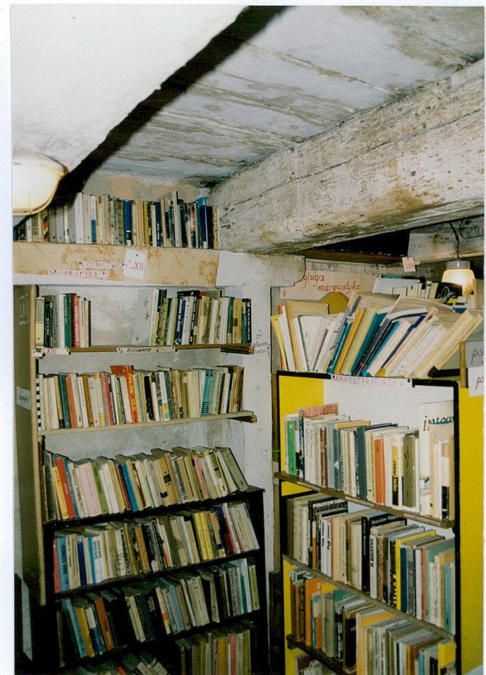
17. Belka podciagu i słup wspierający belki stropowe na pierwszym piętrze spichrza.