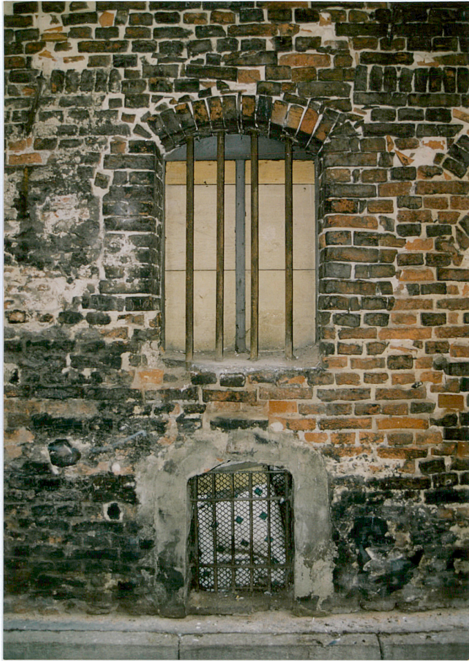
12. Otwory okienne w przyziemiu elewacji pd.