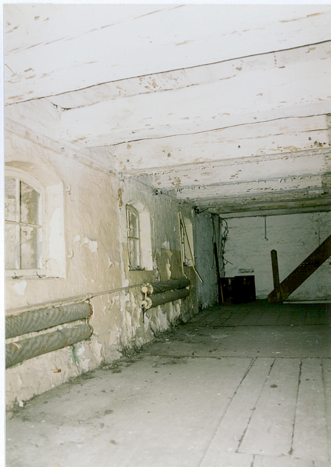
20. Belki stropowe na trzecim piętrze spichrza. Widok narożnika pd. –wsch.