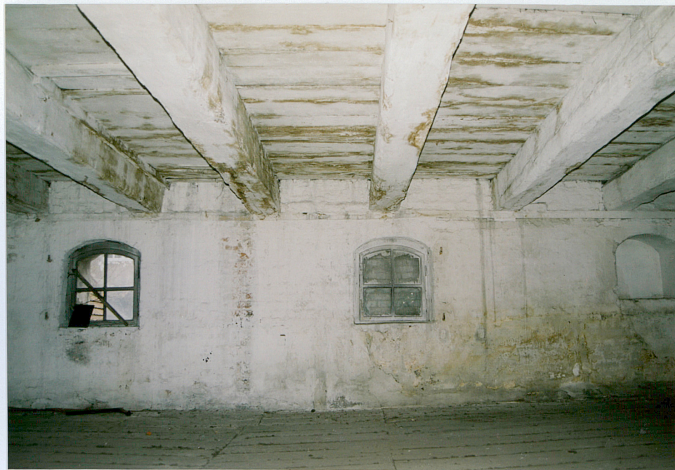
21. Belki stropowe na trzecim piętrze spichrza. Widok muru zachodniego.