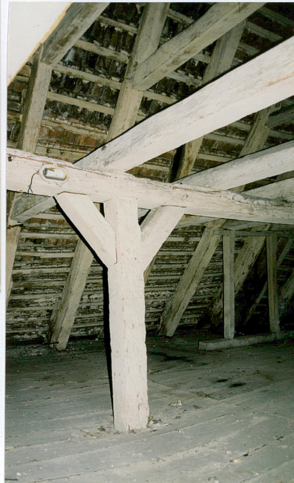
24. Słup zmieczowany z ryglem ramy podłużnej więzby dachowej.