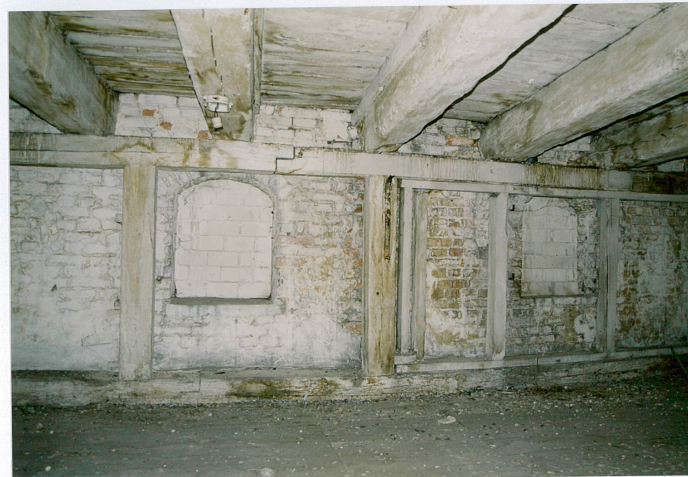
19. Widok fragmentu konstrukcji usztywniającej belki stropowe na drugim piętrze spichrza. Widok narożnika pn. – zach.

Wkładkę założył: mgr Piotr Tuliszewski 16.11. 2002 r.