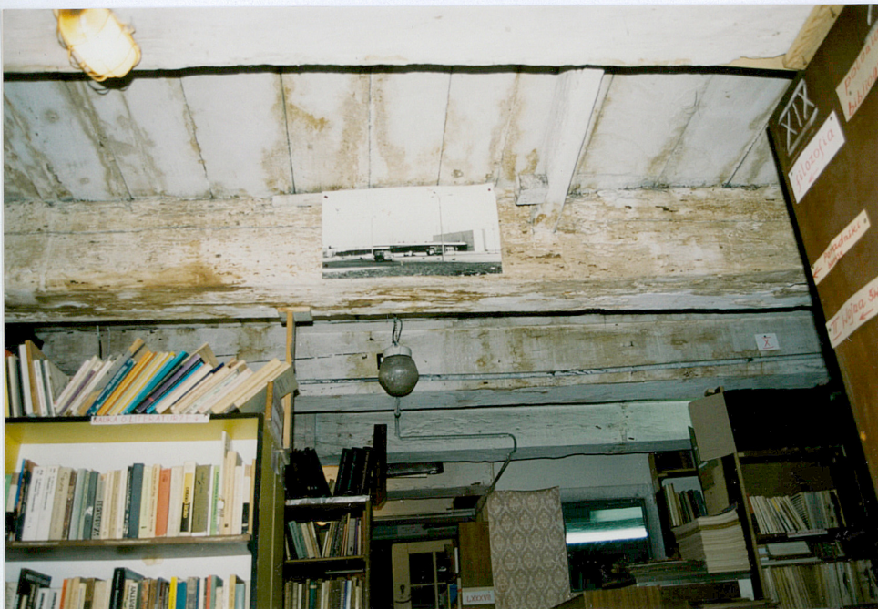
16. Strop belkowy na pierwszym piętrze spichrza.