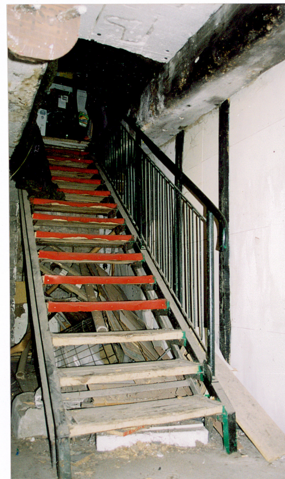
28. Schody metalowe z drewnianymi stopnicami do piwnicy.