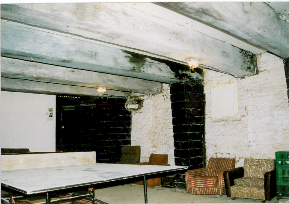
15. Strop belkowy piwnicy spichrza.