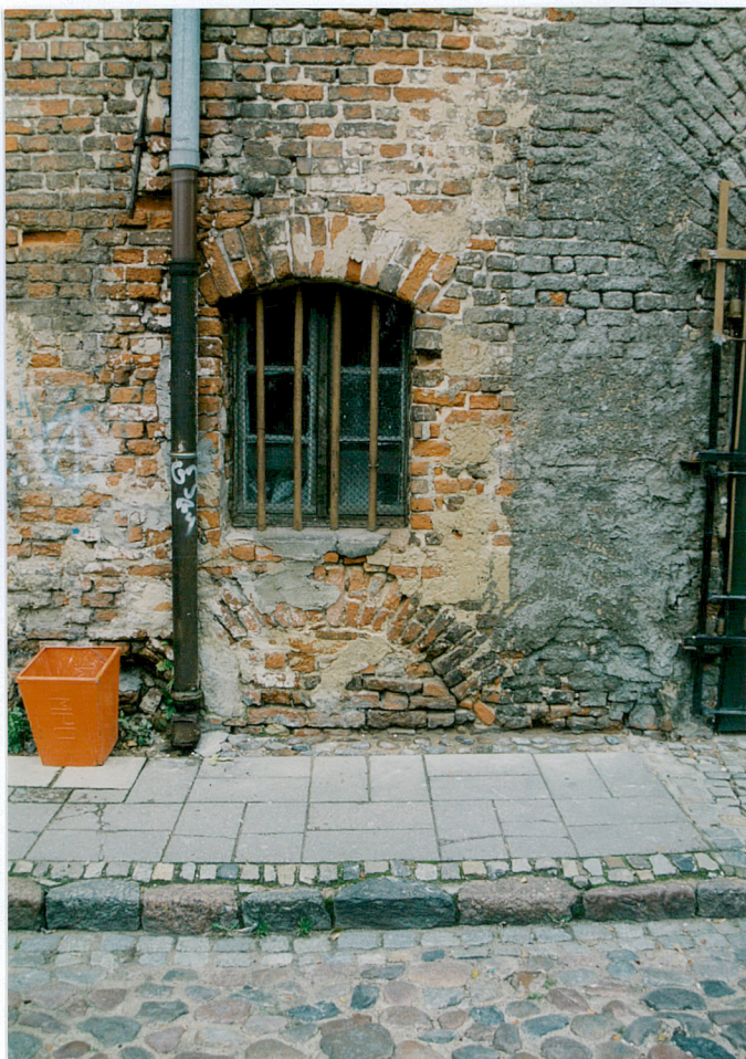
8. Okno krosnowe, dwuskrzydłowe, ze szczelinami poziomymi na parterze elewacji frontowej