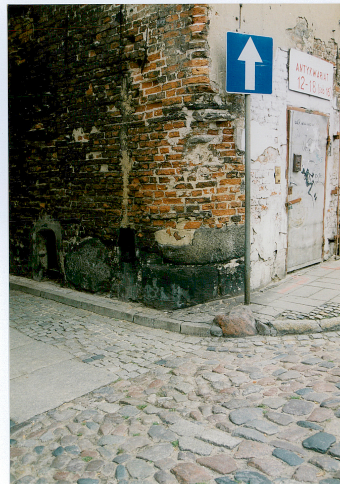
4. Zaokrąglony narożnik pd. – wsch. budynku.