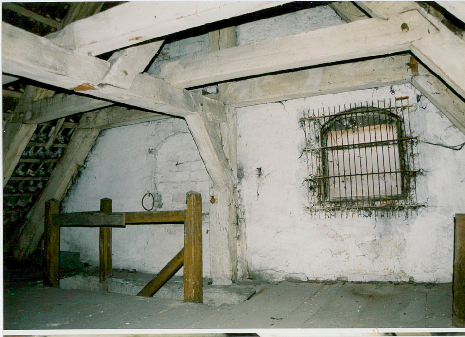
23. Widok górnej partii konstrukcji usztywniającej storczyk.

25. Połączenie jętki z krokwią na wręby pletwowe.