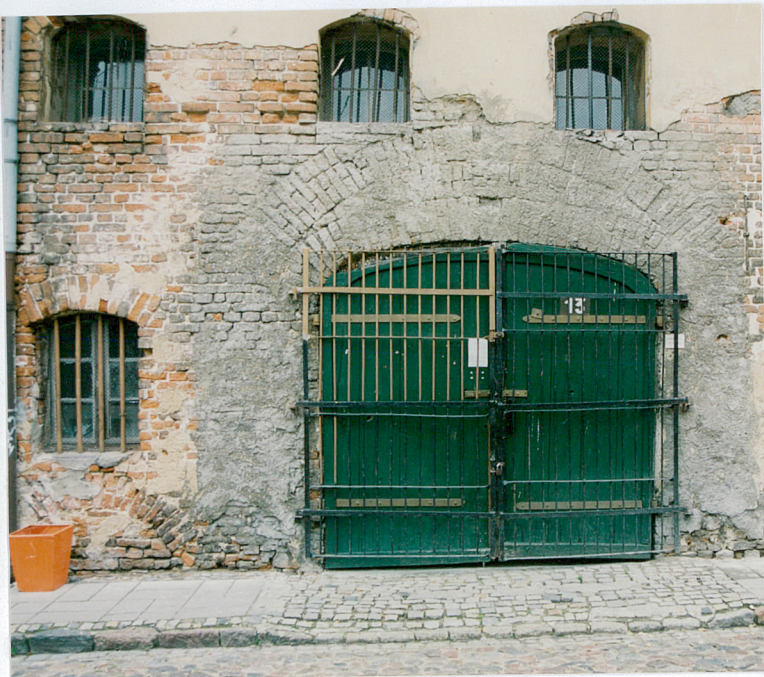
5. Wrota w przyziemiu spichrza.

30. Zawartość wkładki (nazwa obiektu lub materiału uzupełniającego) fotografie