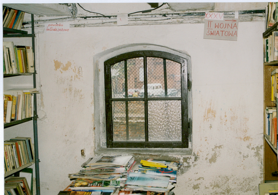
9. Okno krosnowe ze szczelinami krzyżowymi na piętrze spichrza