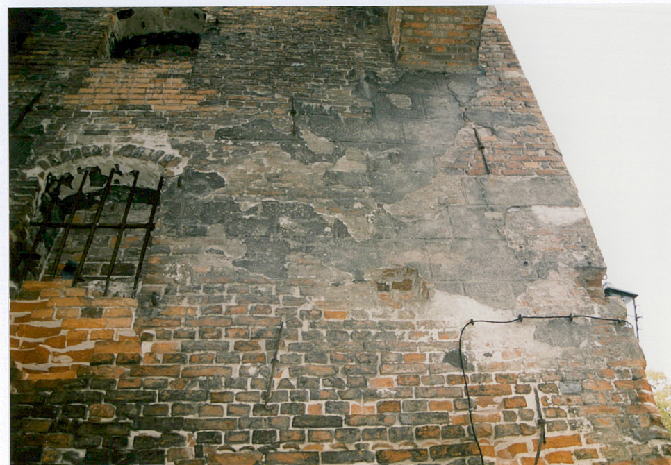
11. Zachowane fragmenty boniowania tynku na wysokości pierwszego piętra elewacji pd.