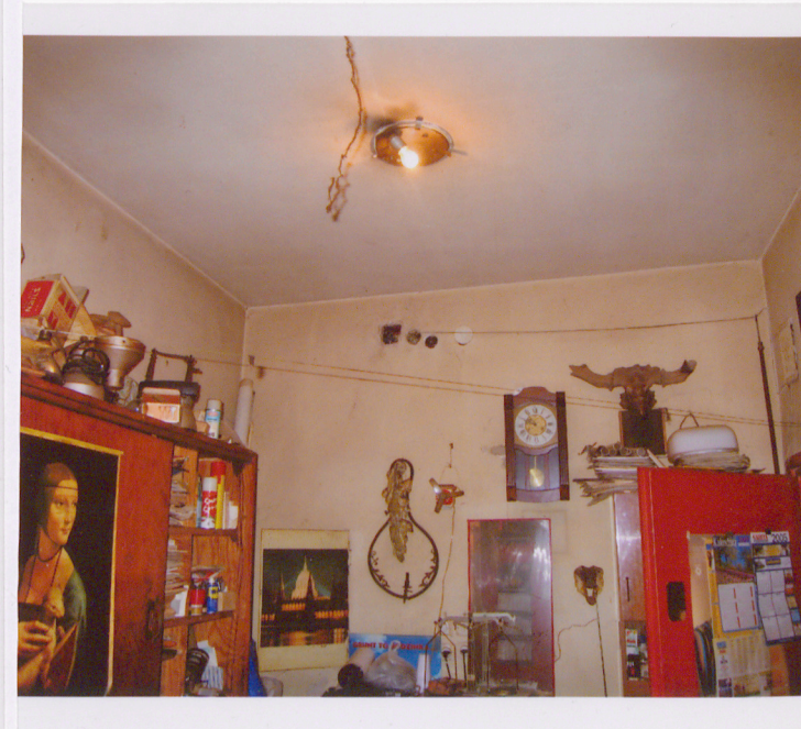
14. Widok ogólny sali na 1 piętrze w kierunku pd.-zach. 15. Zbliżenie wnęki w murze pd. 16. Widok pomieszczeń zaplecza-pracowni fotograficznej.