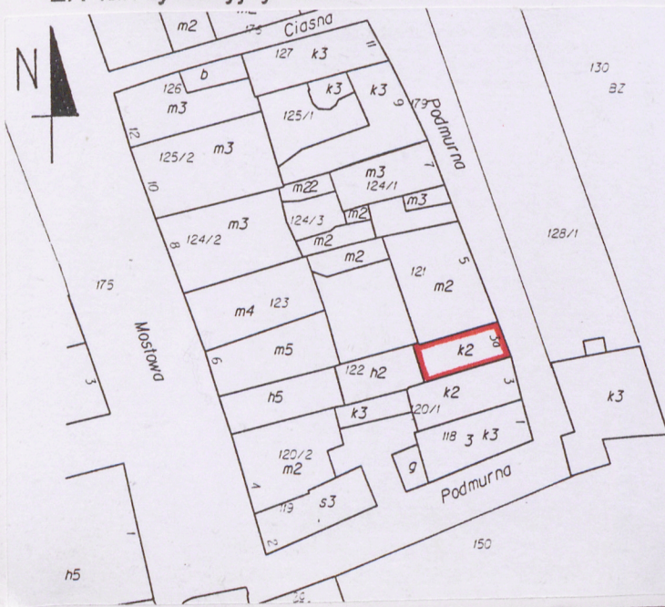
2. Plan sytuacyjny. Skala 1:1000