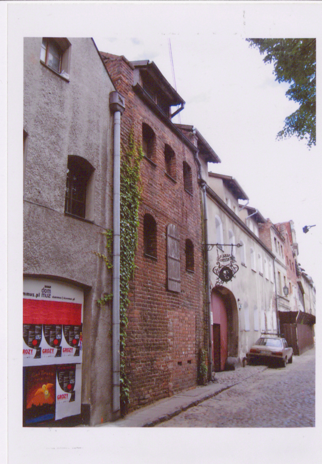
4. Widok ogólny spichrza od pd.-wsch.

Instalacje: wod.-kan. , co., elektryczna