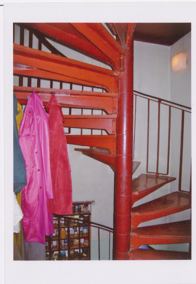
25. Widok konstrukcji schodów i sposobu połączenia rdzenia ze stopniami.