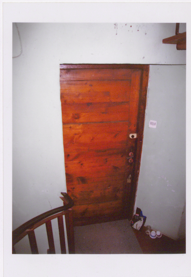
8. Przejazd bramny pod budynkiem przy ul. Podmurna 5. 9. Główny otwór wejściowy do spichrza. 10. Główny otwór wejściowy. Widok od strony wnętrza. Po prawej drzwi w głównym otworze wejściowym.