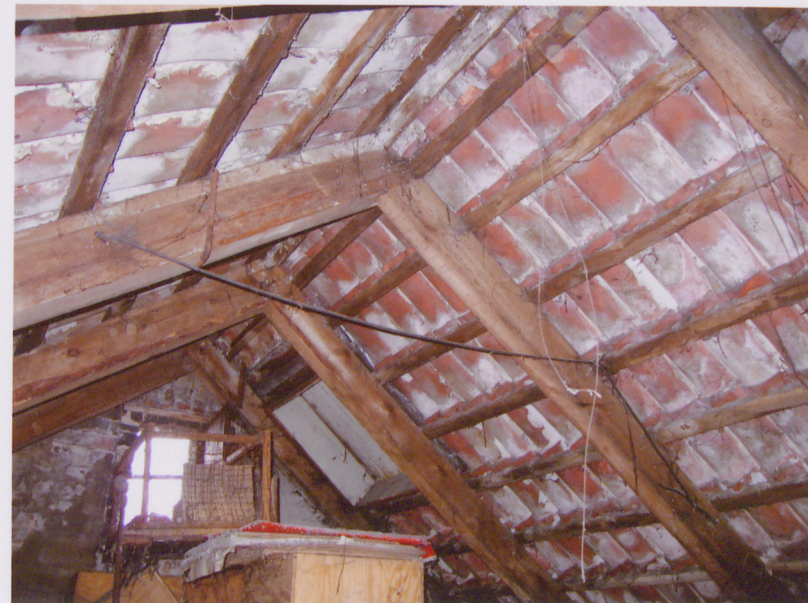
21. Widok połączenia krokwi w kalenicy. Fragment więźby dachowej.