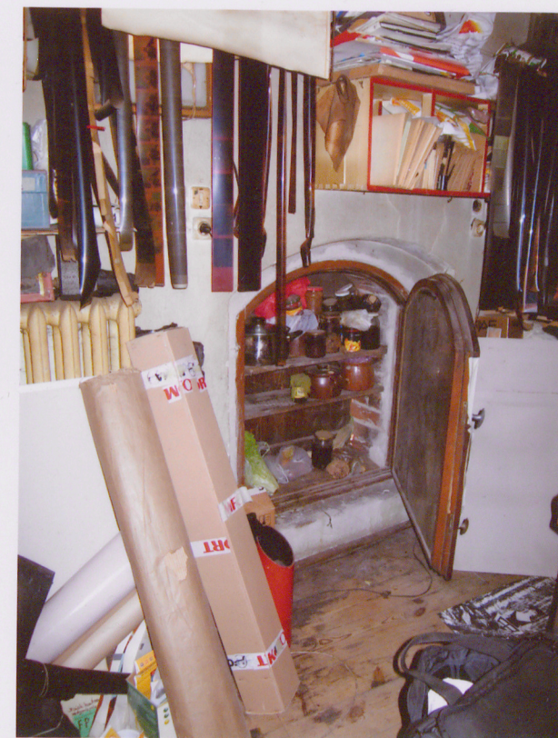
17. Widok ogólny pomieszczenia na 2 piętrze nakrytego sufitem. 18. Współczesna stolarka drzwiowa 19. Otwór okienny użytkowany jako szafka. w pomieszczeniach zaplecza. Widok muru pn. na 1 piętrze.

Wkładkę założył: ..... (imię, nazwisko, data)