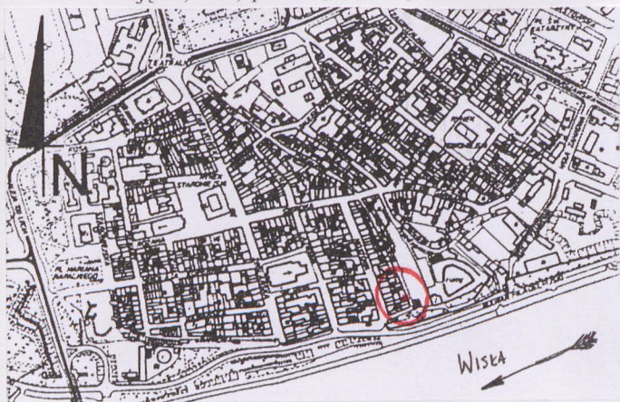
1. Plan orientacyjny. Skala 1:20 000

11. Zdjęcia, rzut, przekrój, sytuacja, orientacja