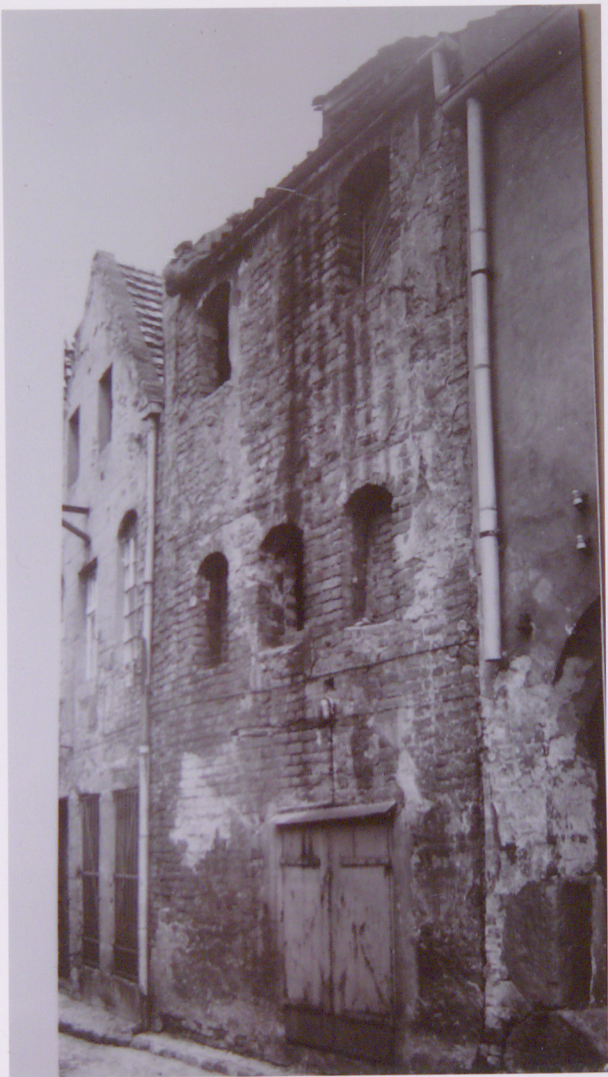
31. Widok elewacji frontowej spichrza przy ul. Podmurnej 3a . Reprodukcja fot. M. Sowińska, 1973, Archiwum ROBiDZ w Toruniu, nr neg. w PP PKZ w Toruniu 5504/1.