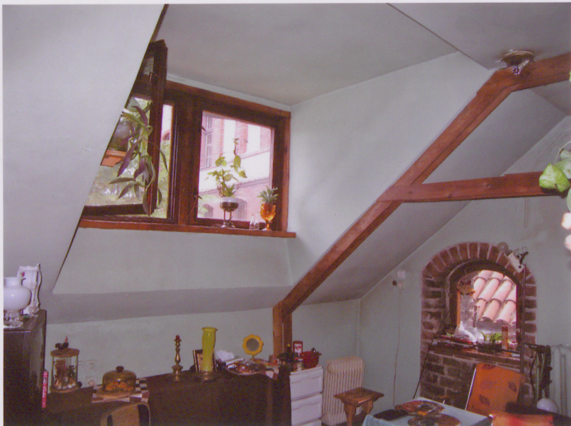
20. Widok wnętrza pomieszczenia na poddaszu.

Po prawej fragment konstrukcji więźby dachowej.