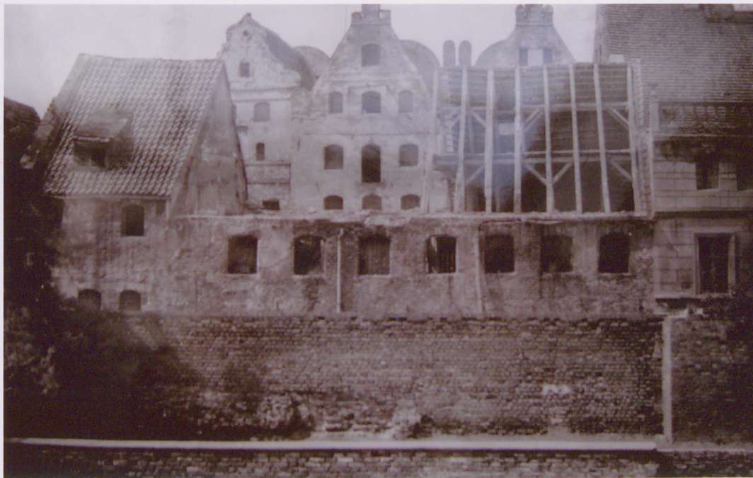
37. Widok dudynków przy ul. Podmurnej 3a i 5 w trakcie prac konserwatorskich w 1963. Reprodukacja fot. M. Sowińskiej, Archiwum ROBiDZ w Toruniu, nr neg. w PP PKZ w Toruniu 3318 .