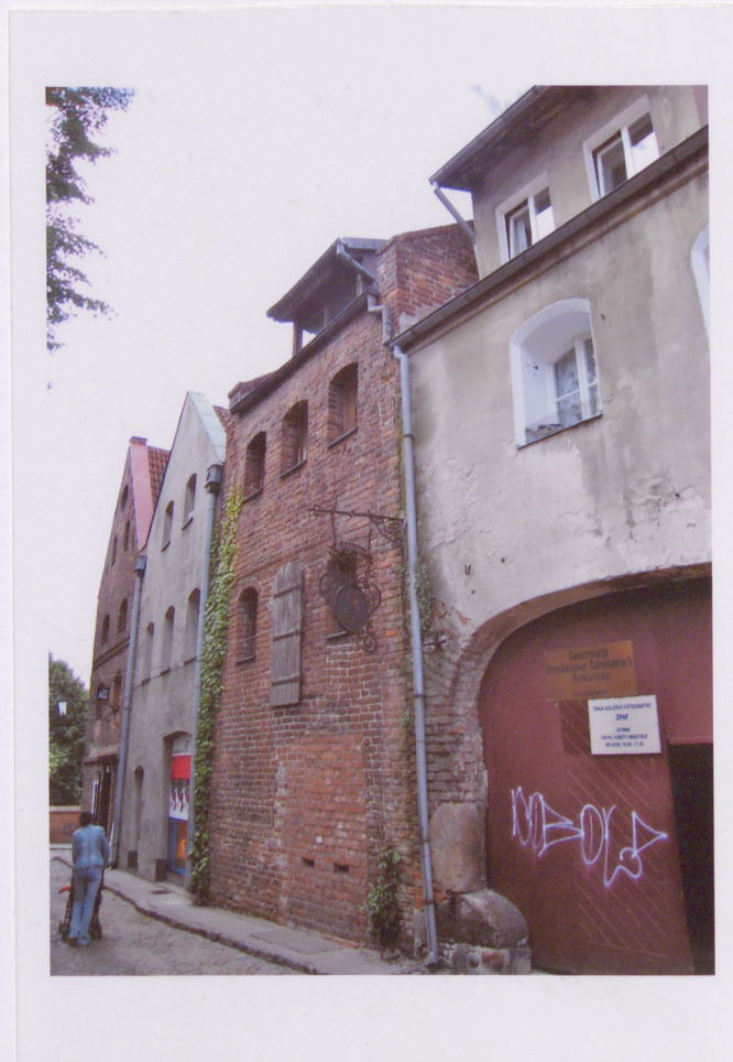
3. Elewacja frontowa spichrza przy ul. Podmurnej 3a Widok ogólny od pn.