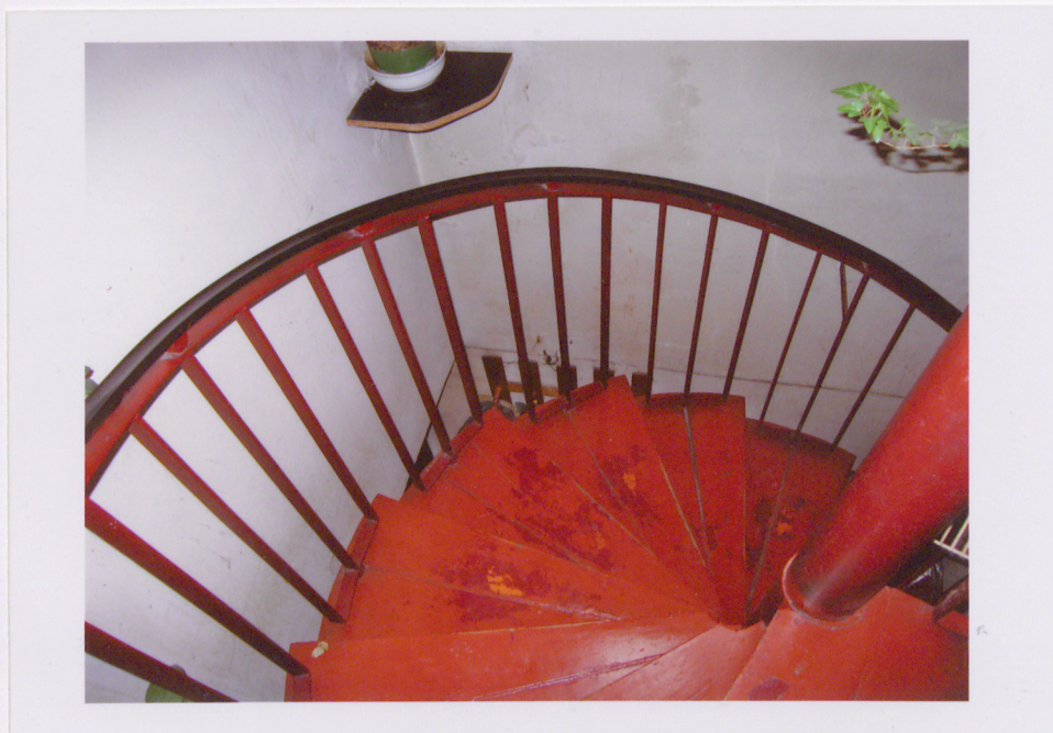
24. Bieg schodów kręconych metalowych z poręczą.