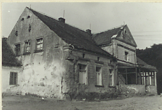
Elewacja frontowa / skrzydło starsze / Elewacja frontowa / skrzydło nowsze /