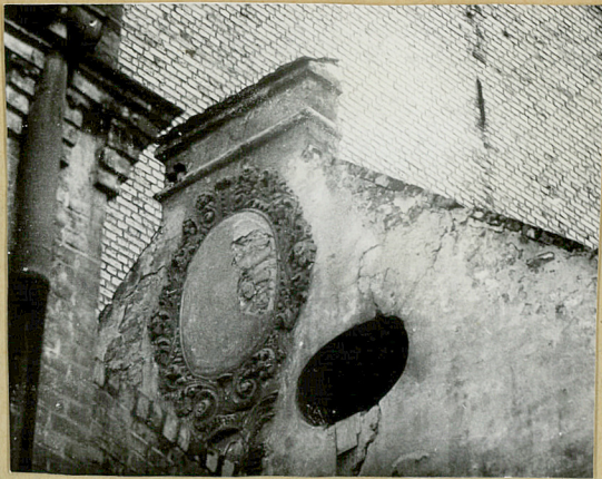
Szczyt elewacji podwójkowej