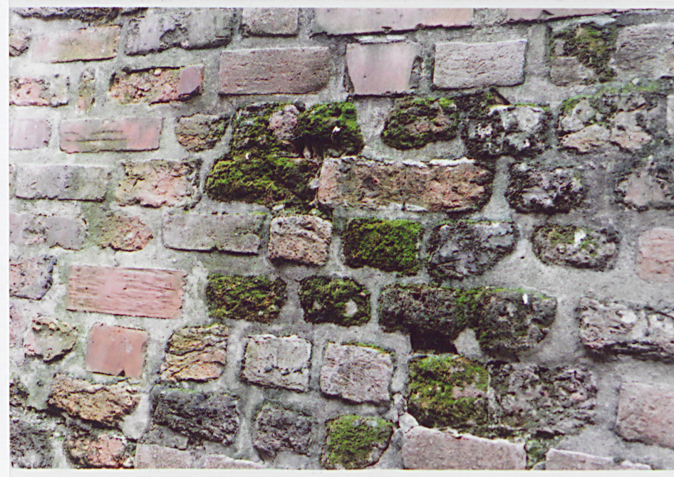
Fot. 15 - Fragment lica zachodniego muru w części środkowej.