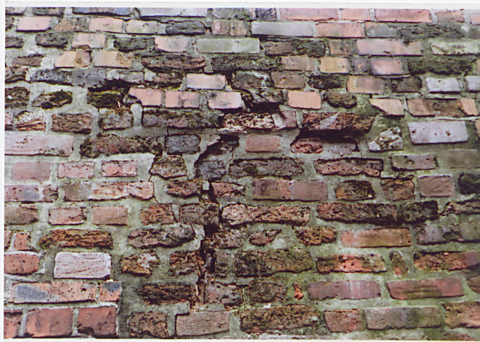
Fot. 16 - Fragment lica zachodniego w odcinku środkowym.