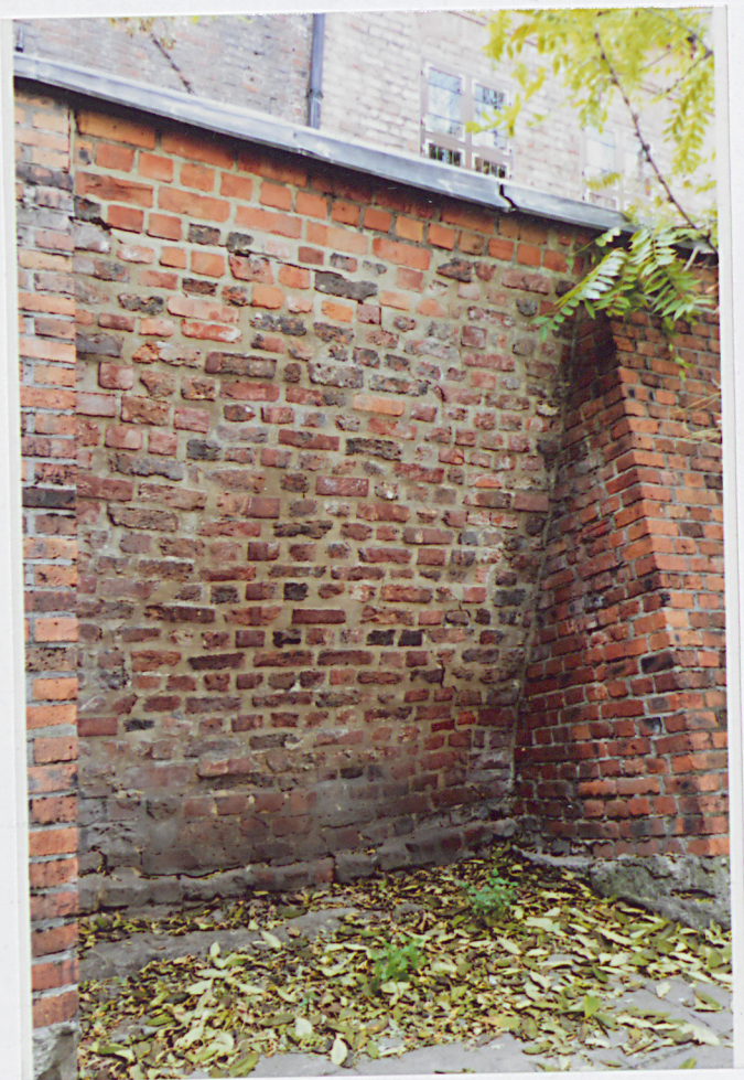
Fot. 4 - Lico wschodnie, odcinek między dwiema szkarpami środkowymi.