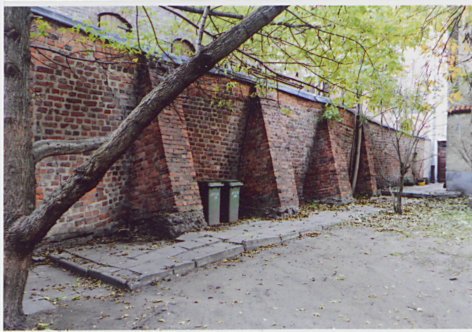
Fot. 2 – Widok ogólny muru od strony południowo-wschodniej.