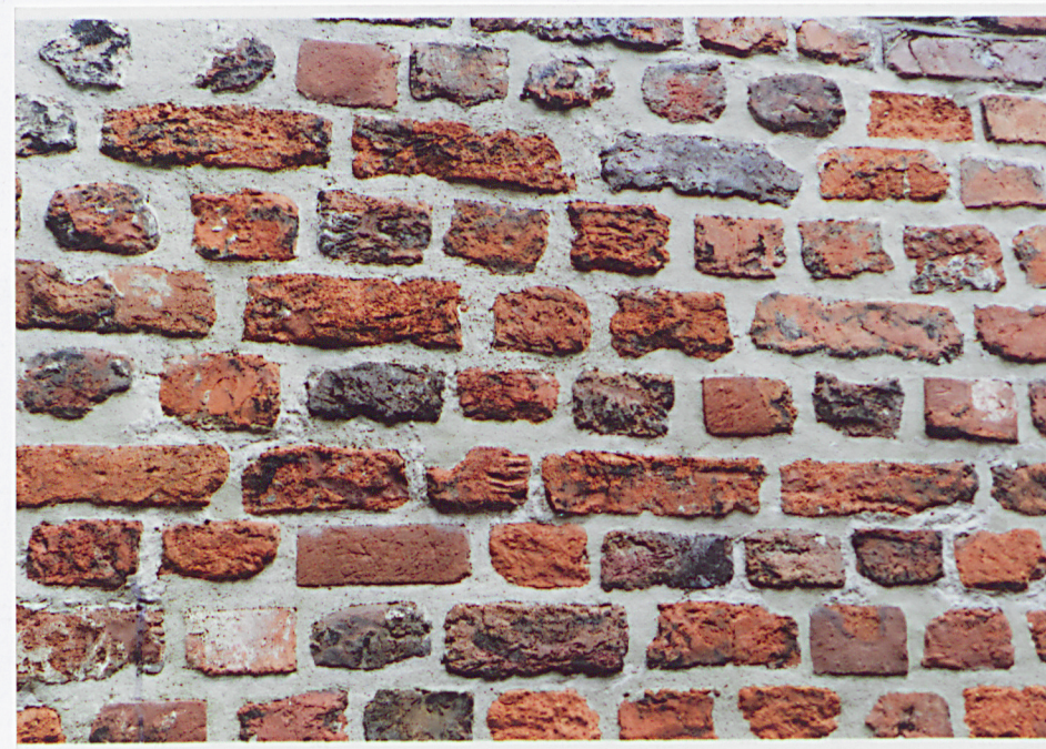
Fot. 13 – Fragment lica zachodniego w odcinku północnym.