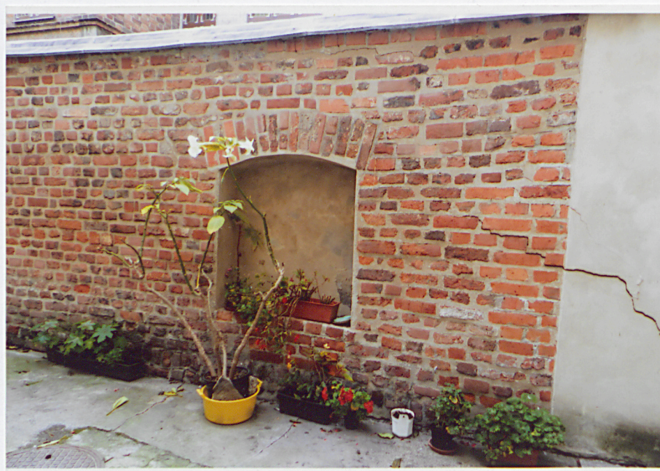
Fot. 7 – Lico wschodnie. Wnęka w odcinku północnym.