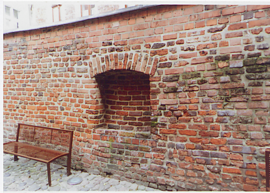
Fot. 11 - Część północna lica zachodniego muru.