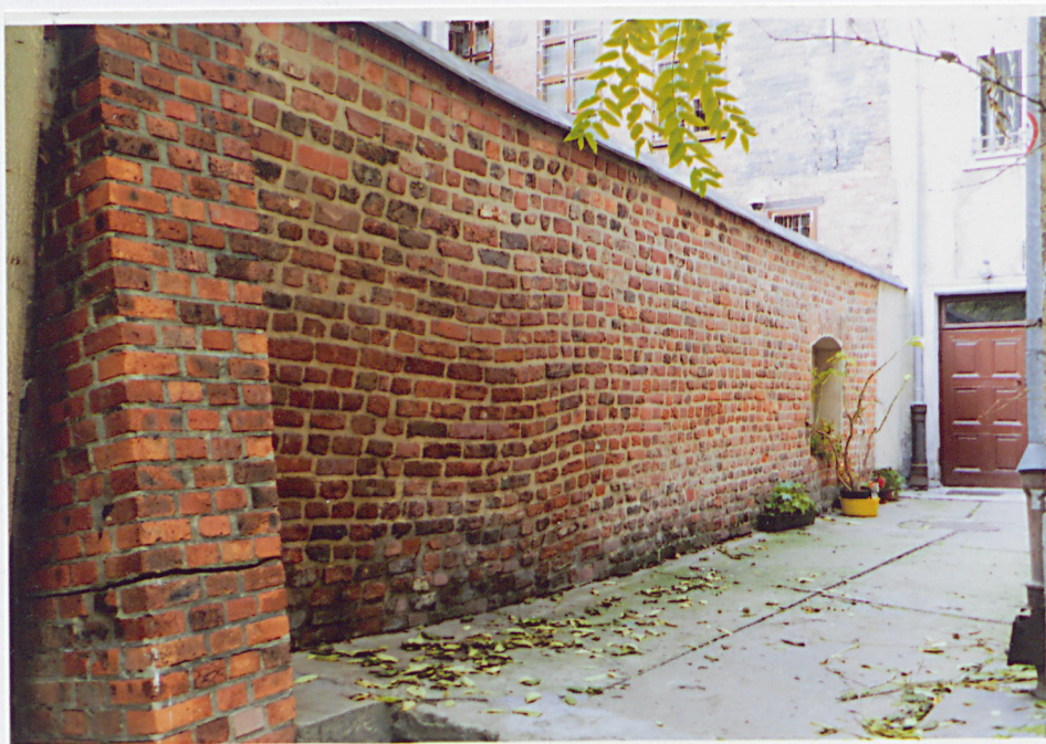
Fot. 6 - Lico wschodnie, odcinek północny.