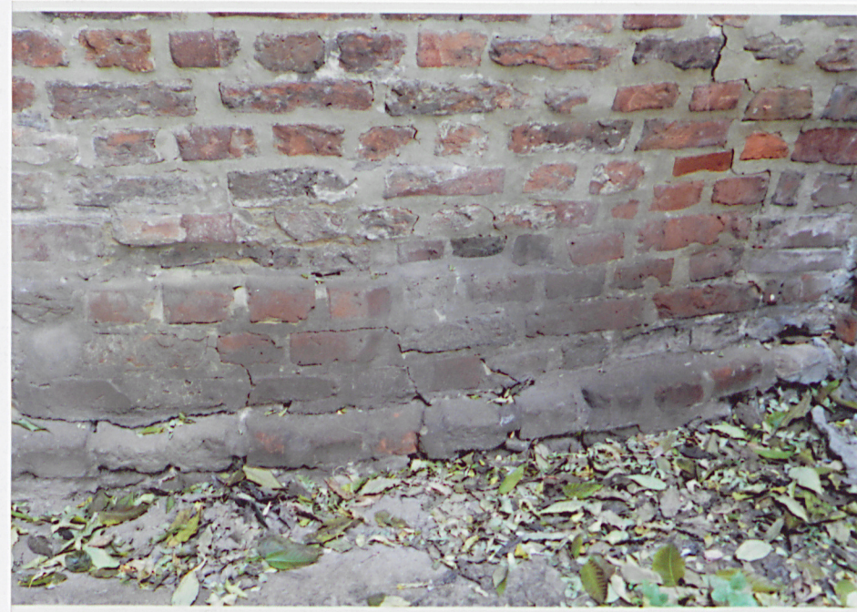
Fot. 8 – Dolny fragment lica wschodniego z zachowaną starszą spoiną.