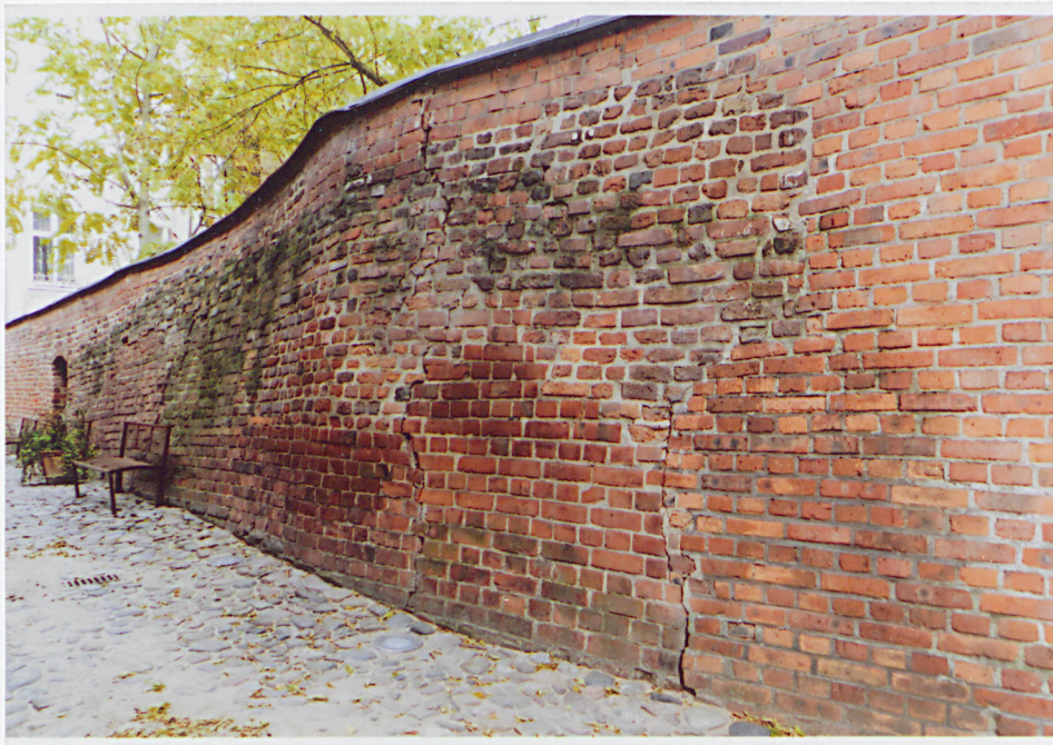
Fot. 14 - Część południowa lica zachodniego muru.