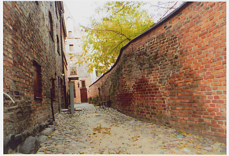
Fot. 10 - Widok na mur od strony pd.-zach..