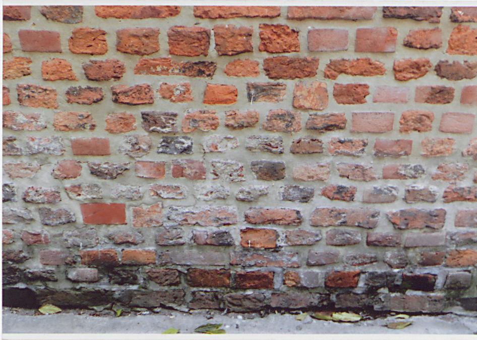
Fot. 9 - Dolny fragment lica wschodniego w części północnej.