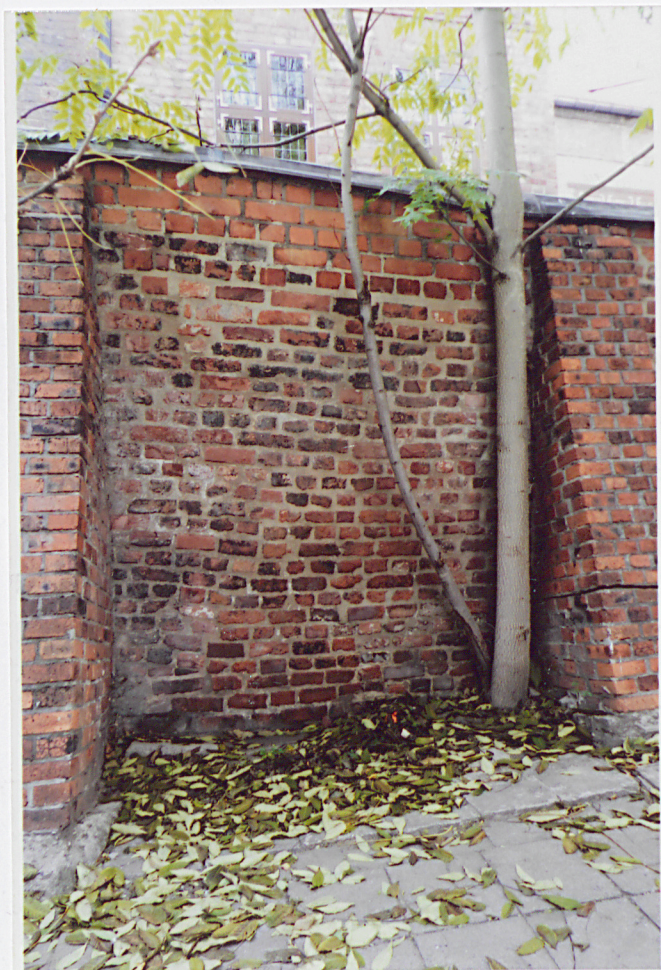
Fot. 5 - Lico wschodnie, odcinek między dwiema szkarpami prawymi (północnymi).