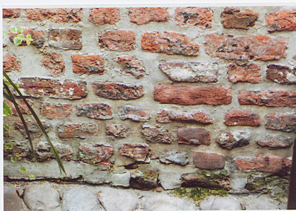
Fot. 12 – Fragment dolnej strefy lica zachodniego w odcinku środkowym.