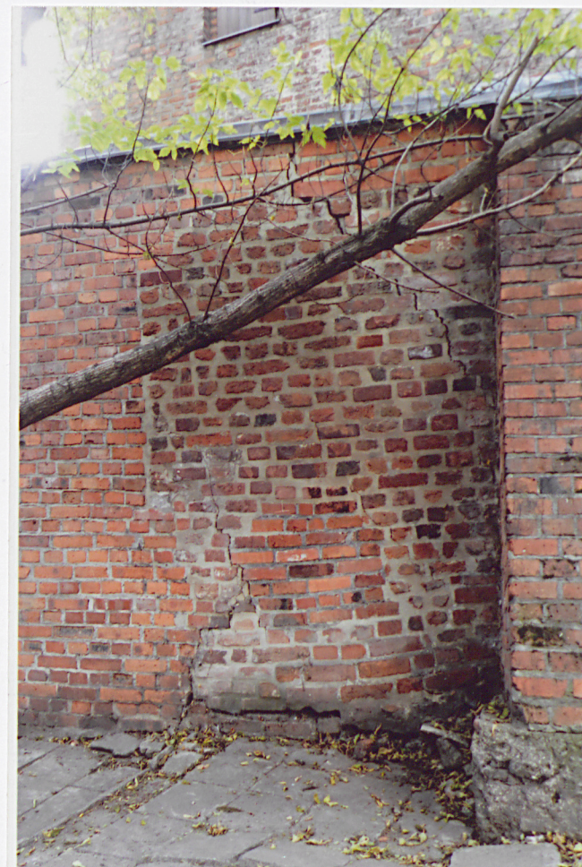
Fot. 3 – Odcinek pd. elewacji wschodniej przy granicy z częścią współczesną.