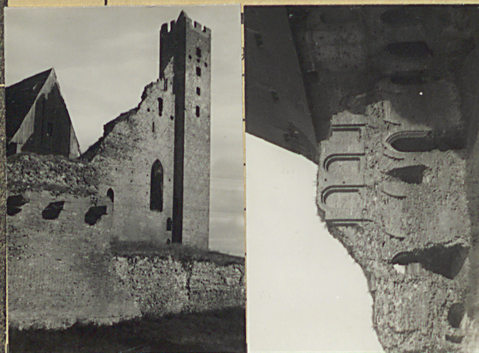
35. Uwagi rozne wainiifera Ichthyografia: B. Giron, et. in. Reise J. Die Con. u. Kunstschiff- maler der Provinz Wpt.; Schmidt. B. Bou. u. Kunstschiffmaler der Ordensst. in Preussen; Claren: Die Mittelalterliche Kunst im Behalt der Archäologischen Preussen - Die Burgbaukunst Königs. 1927. Molodtsh: Etische na Poudren, Tomi 1932; i W. in.

B. Podrocznik . Ze wst. i zał. od zemb. mianyma pismstwiei Wzór jednoraz. — CWD, W-wa, Bielańska 18, zam. Nr 2161/S2/III reimderstia pomiednie WDA, Z. 461 12. II. 55 20,000 A4 Karton kl. 7 160 g 12. II. —19. II. 55 z zachowaniem pami w cozoci murem obwiedzy.