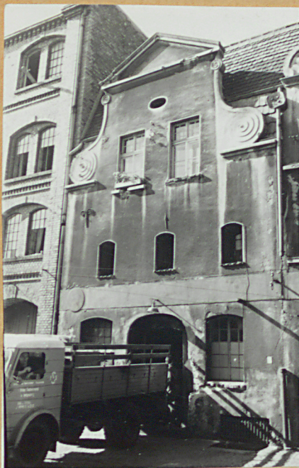
Elevacja frontowa. 3x67

31. Szkic sytuacyjny, plan schematyczny, uwagi opisowe, fotografia