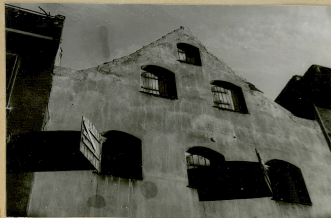
Szczyt elewacji frontowej.

Spichrz przylegający ze strony zach. do obok stojącego gotyckiego spichlerza z XIV w. Elewacja front. zwrócona na północ.