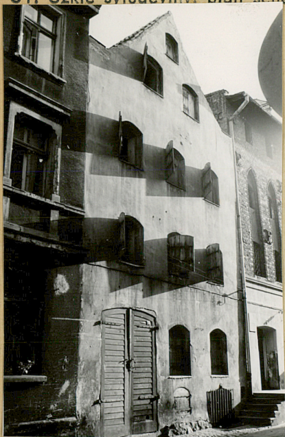
Elewacja frontowa. Widok z ul. Rabskiej.

31. Szkic sytuacyjny, plan schematyczny, uwagi opisowe, fotografia