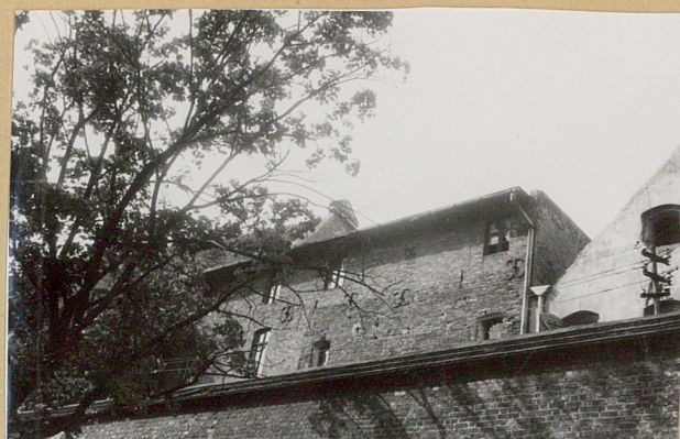
Fragment elewacji tylnej. Widok od strony Wisły.