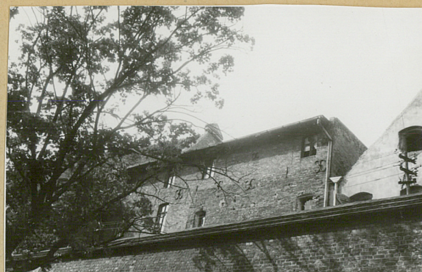
Fragment elewacji tylnej. Widok od strony Wisły.