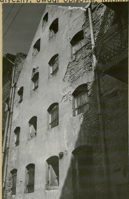
Elewacja tylna. Widok z ul. Pod Kryną Wież.

Spichrz przylegający ze strony zach. do obok stojącego gotyckiego spichlerza z XIV w. Elewacja front. zwrócona na północ.