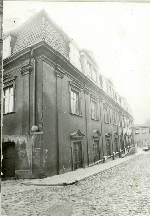
Założył J. Poklewski XI, 1978 neg. BDZ Toruń