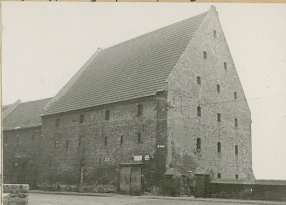
Widok p.m. - wsch.