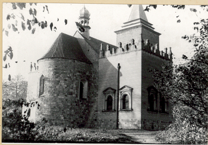
KOŚCIELEC KOŚCIÓŁ ŚW. MAŁGORZATY