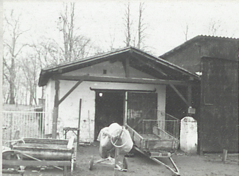
Kuźnia, ob. magazyn (2) - elewacja południowa