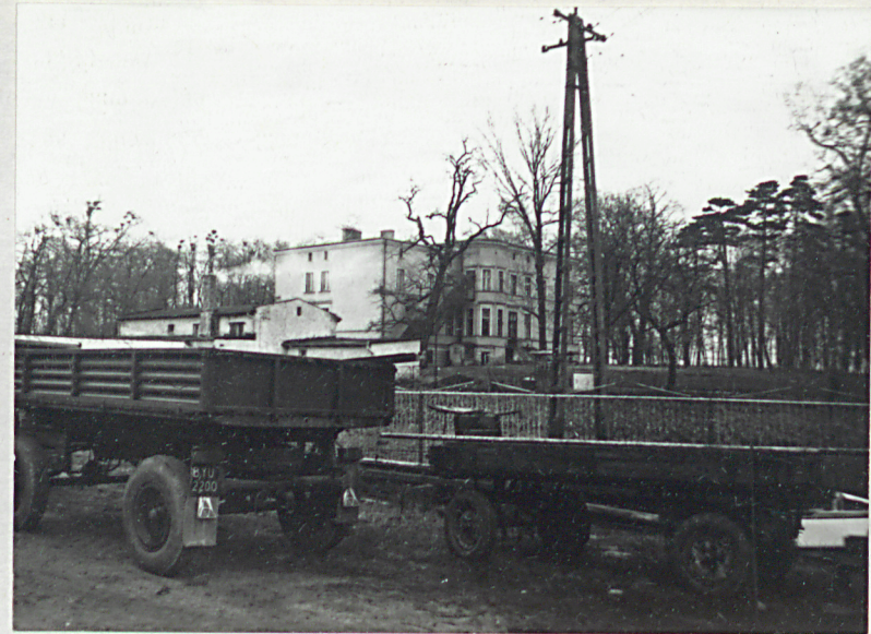
Widok pałacu od strony podwórza