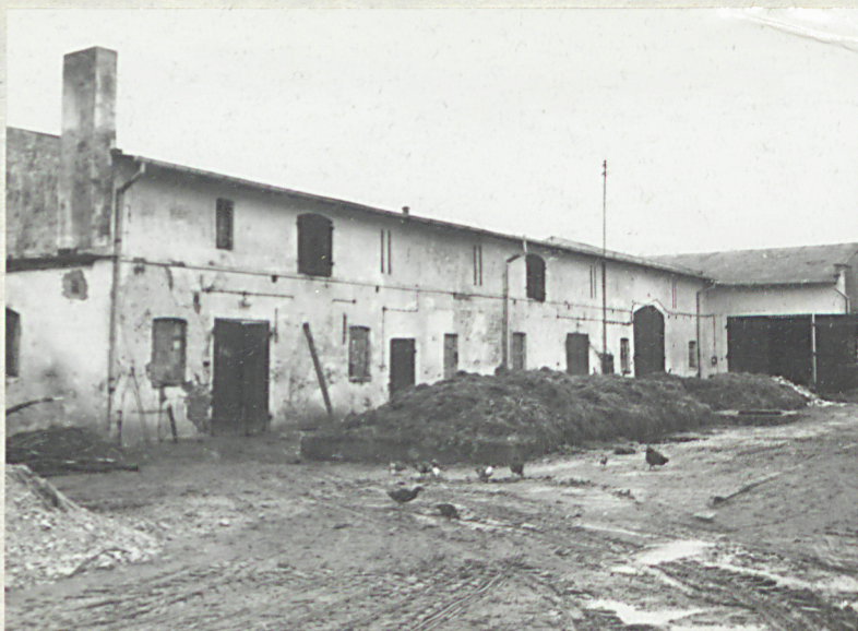
Budynek inwentarski (4) - elewacja zach.