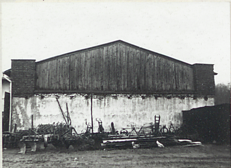
Stodoła (5) - od strony zachodniej

3. Zawartość wkładki: zdjęcia - budynek inwentarski i stodoła (4 i 5)