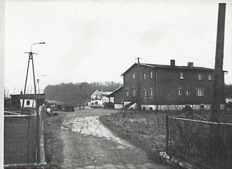
Główna brama wjazdowa na podwórze gosp.