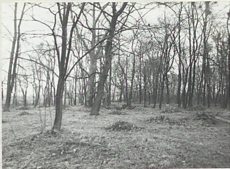
Fragmenty parku pałacowego