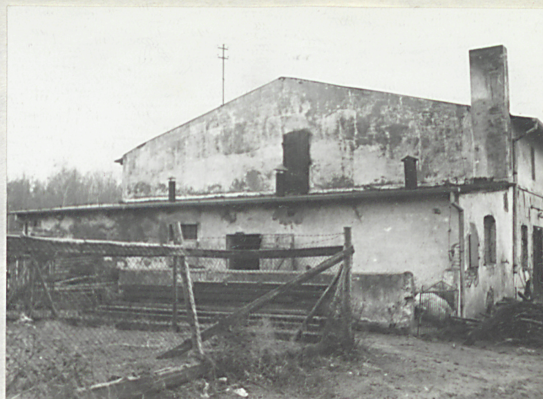
Budynek inwentarski (4) - elewacja pñn.