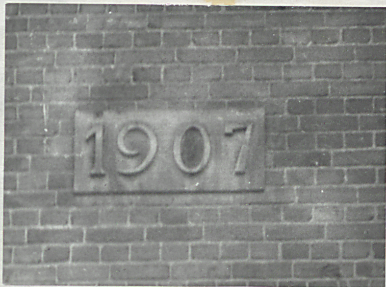
Datownik na elewacji północnej