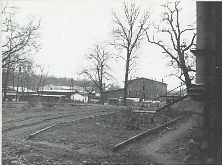
Widok podwórza gospodarczego od strony pałacu