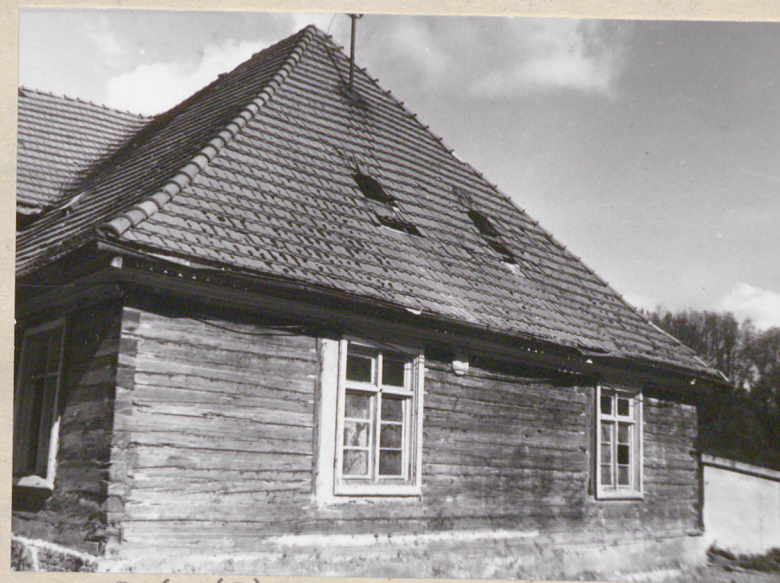
Dwór (I) - elewacja wschodnia