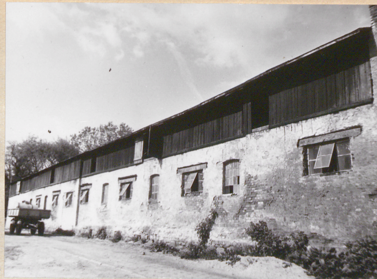
Elewacja wschodnia - część północna