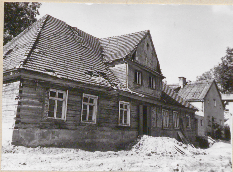
Dwór (I) - elewacja północna