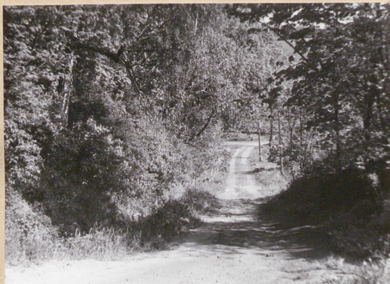
Droga prowadząca w kierunku wsch. do wsi Gródek