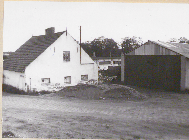
Widok centralnej części podwórza gosp. (na pierwszym planie widoczny magazyn (6))