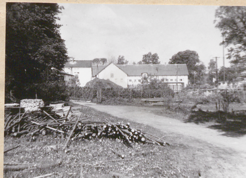
Droga łącząca podwórze gosp. z zespołem dworsko-parkowym