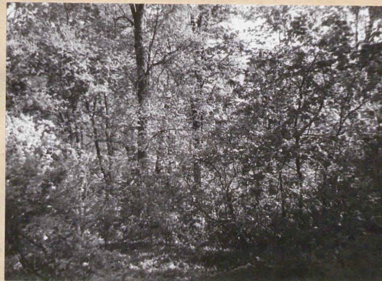
Fragment południowej części parku