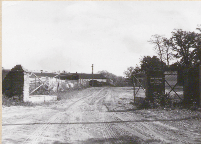
Południowa brama wjazdowa w zach. pierzei podwórza gospodarczego