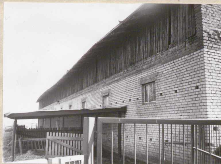
Elewacja zachodnia - część południowa