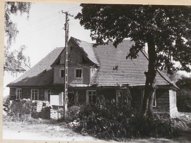
Dwór (I) - elewacja południowa