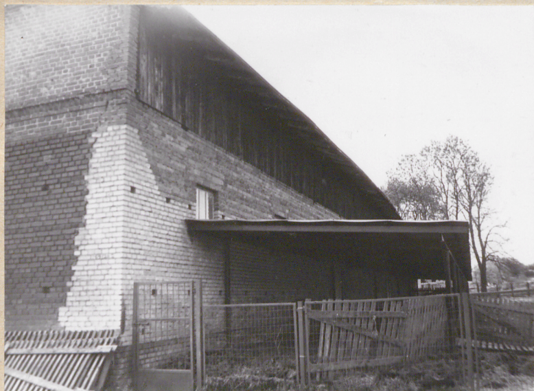
Elewacja zachodnia - część północna