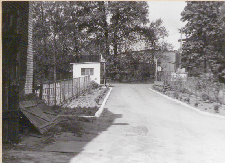
Współczesna brama wjazdowa w zach. pierzei podwórza gosp.