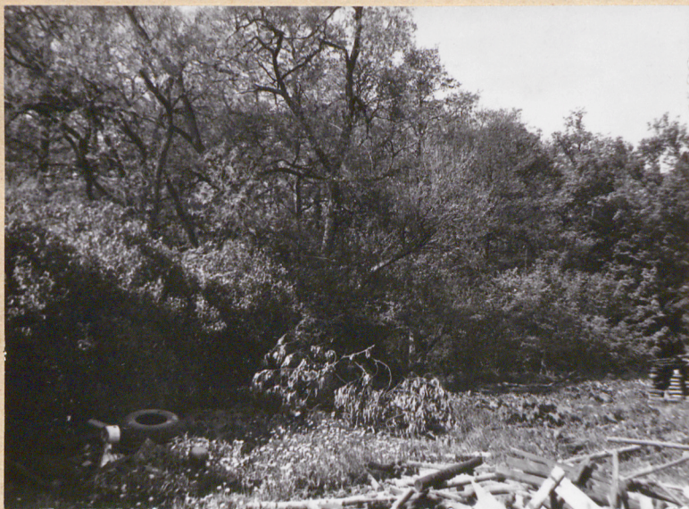
Fragment północnej części parku