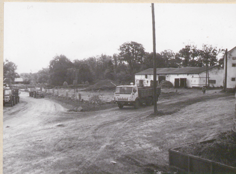
Widok południowej części podwórza gosp.