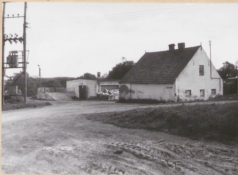
Widok północnej części podwórza gosp.