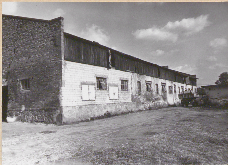
Elewacja wschodnia - część południowa