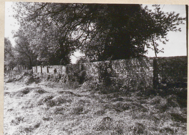
Zachowany fragment muru w zach. pierzei podwórza gospodarczego