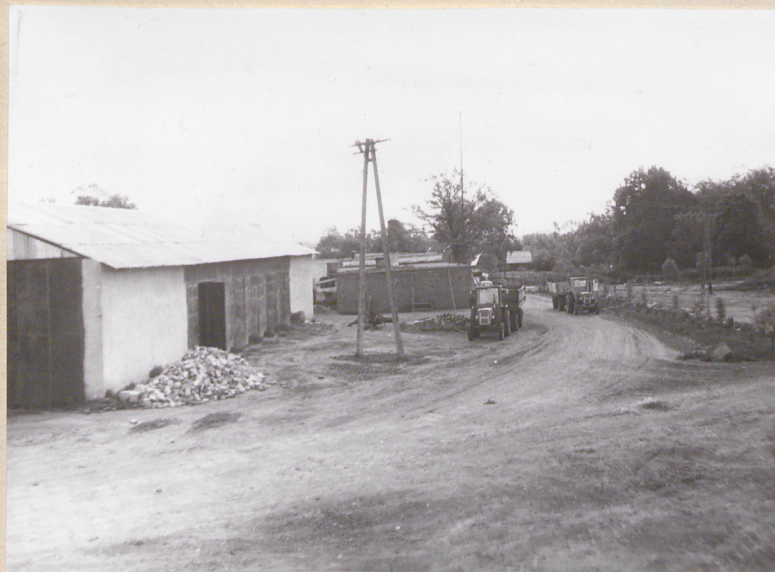
Widok wschodniej części podwórza gosp.