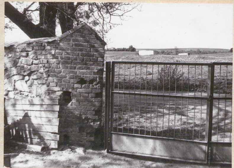
Środkowa brama wjazdowa w zach. pierzei podwórza gospodarczego