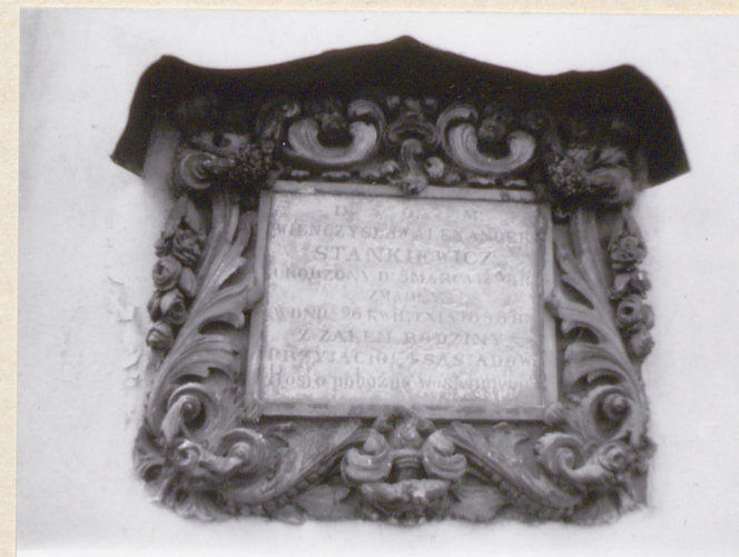
23. Epitafium na elewacji zakrystii