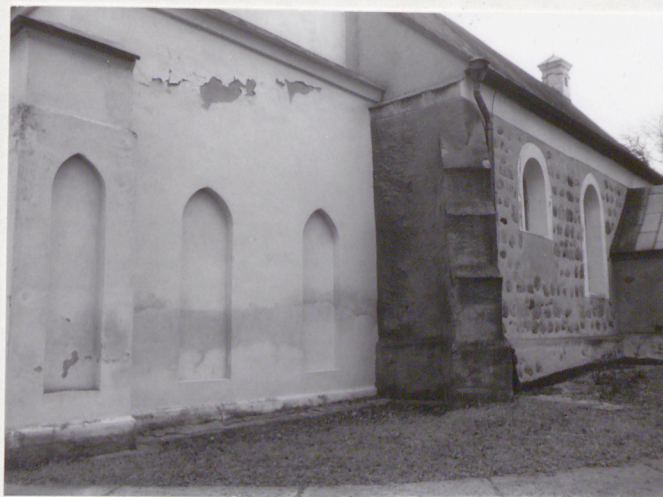
3. Przyziemie wieży / od pd./