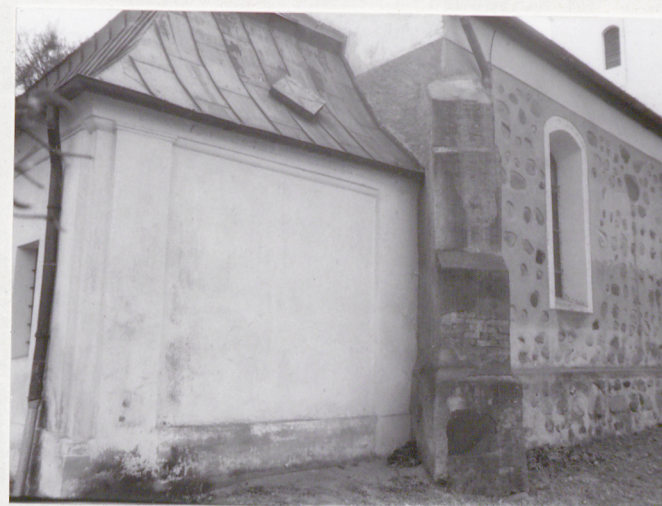
5. Elewacja pn. /zakrystia/

Wkładkę założył: H. Wieczorkiewicz, A. Prinke, XII 95 r. (imię, nazwisko, data)