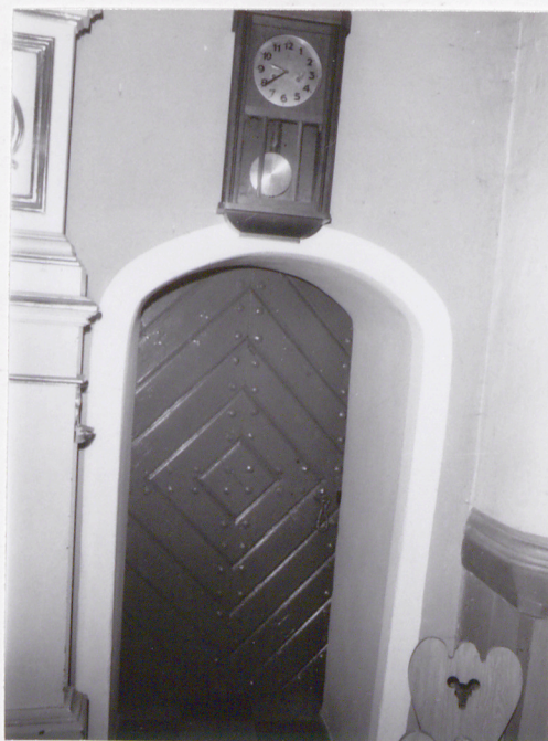
19. Drzwi do zakrystii