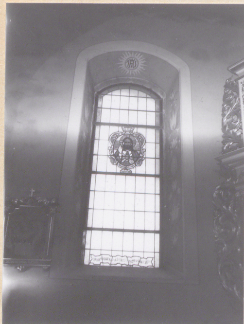
14. Okno korpusu gł./wnętrze/