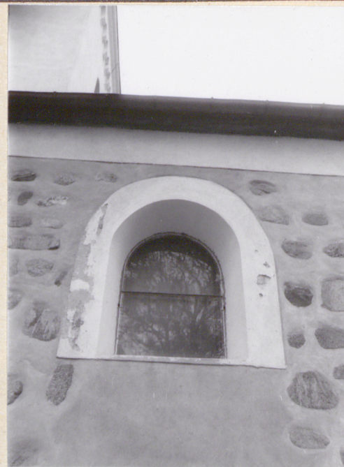
15.16.17. okna nawy głównej