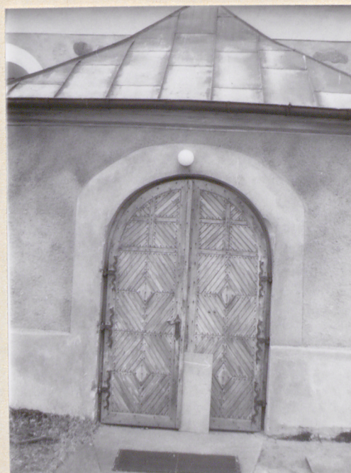
22. Drzwi do kruchty