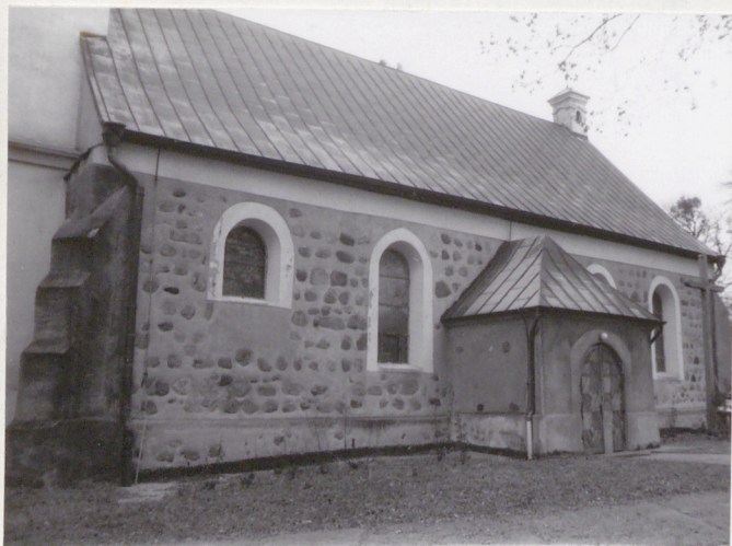
2. Elewacja pd. - korpus gł.

3. Zawartość wkładki (nazwa obiektu lub materiału uzupełniającego) zdjęcia