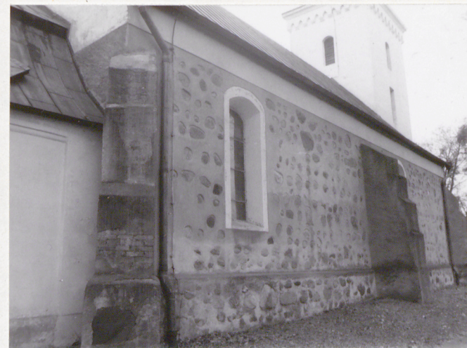
4. Elewacja północna