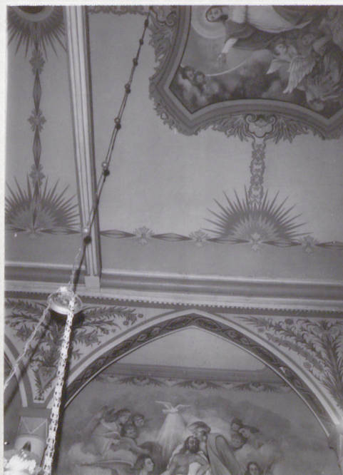
11. 12. 13. WNETRZE