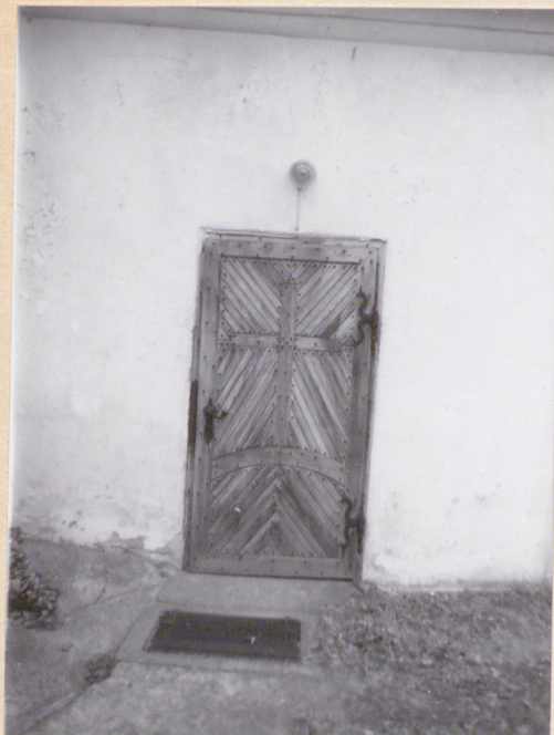
21. Drzwi do zakrystii