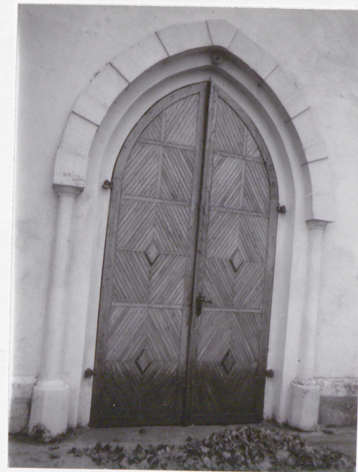
20. Portal główny