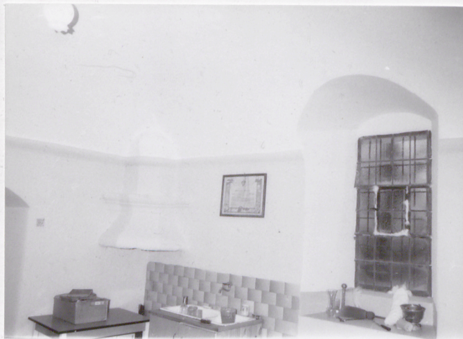
18. Kominiek i okno w zakrystii